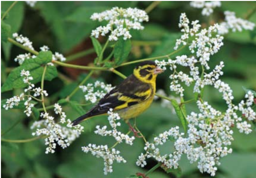
1247# 高山金翅雀 Yellow-breasted Greenfinch Carduelis spinoides 2006-8-13, 西藏日喀则聂拉木, Nyalam, Xigaze, Tibet