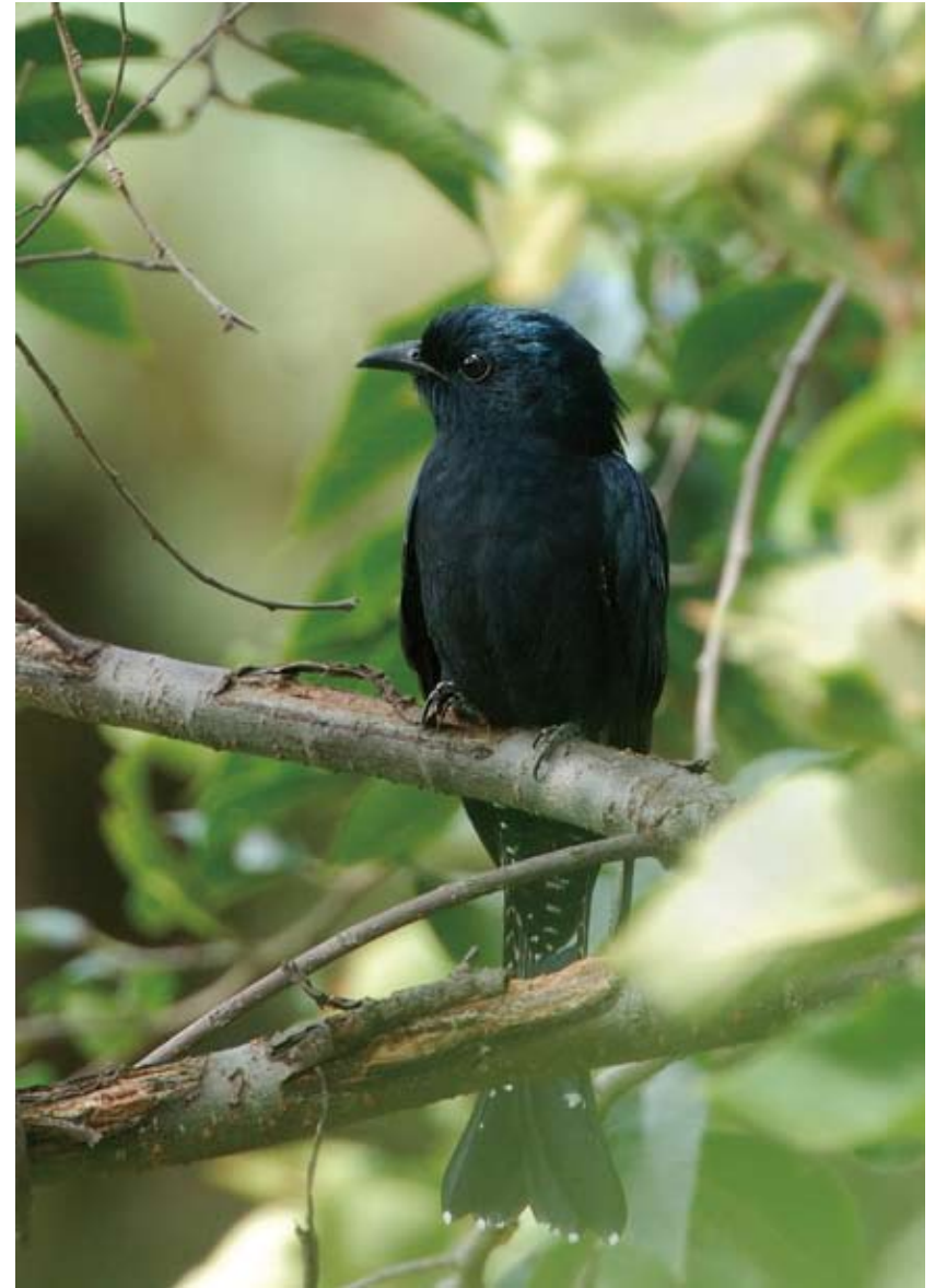
0200# 乌鹃 Drongo Cuckoo Surniculus lugubris 2006-10-2, 云南巍山, Weishan, Yunnan