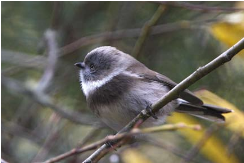
0876# 银脸长尾山雀 Sooty Tit Aegithalos fuliginosus 2006-10-27, 四川平武王朗保护区, Wanglang NR, Pingwu, Sichuan