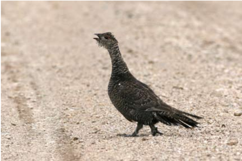
0061# 黑嘴松鸡 Black-billed Capercaillie Tetrao parvirostris 2006-7-12, 黑龙江呼中, Huzhong, Heilongjiang