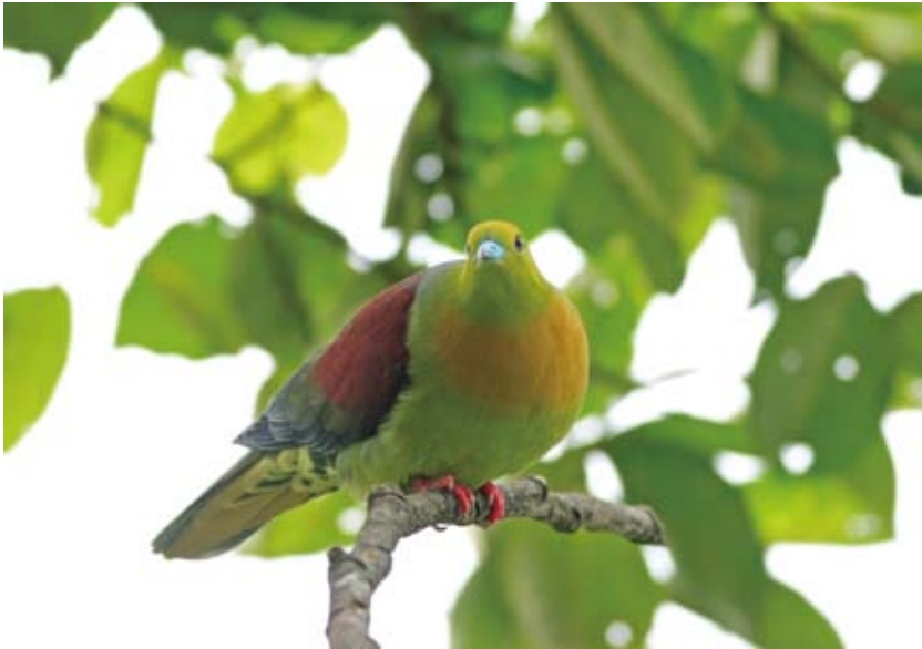
0288# 楔尾绿鸠 Wedge-tailed Green Pigeon Treron sphenura 2006-8-11, 西藏日喀则聂拉木, Nyalam, Xigaze, Tibet