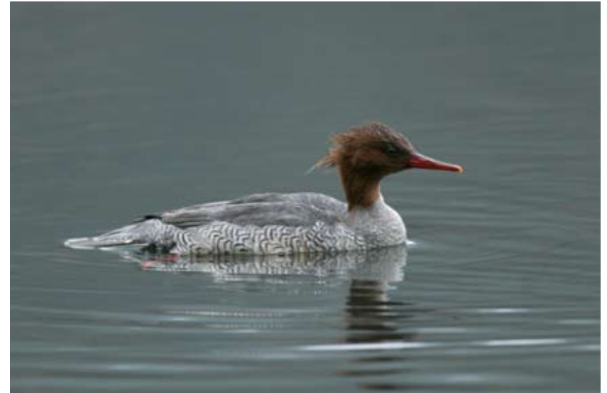
0113# 中华秋沙鸭 Scaly-sided Merganser Mergus squamatus 2006-2-1, 江西婺源, Wuyuan, Jiangxi