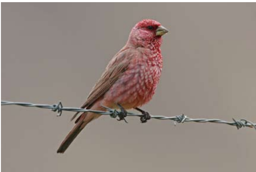
1280# 大朱雀 Great Rosefinch Carpodacus rubicilla 2006-8-9, 西藏定日, Dingri, Tibet