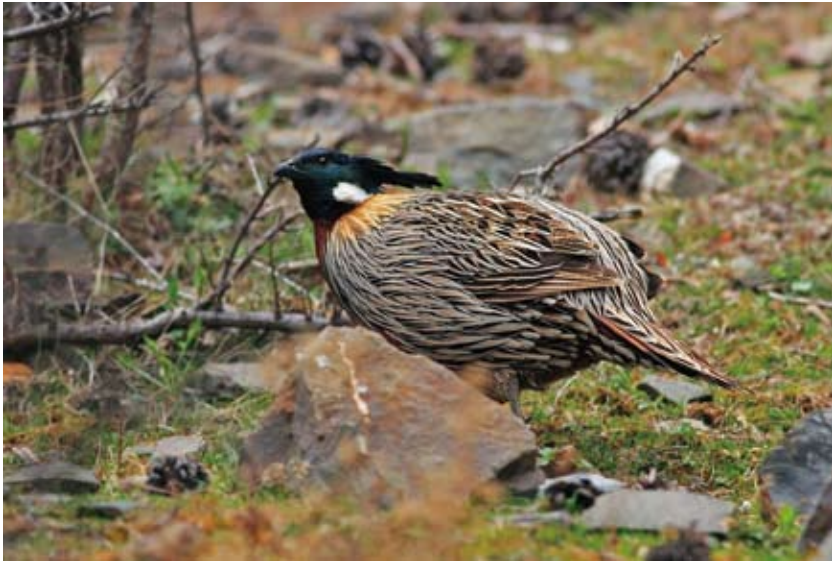
0034# 勺鸡 Koklass Pheasant Pucrasia macrolopha 2006-4-14, 四川甘孜雅江, Yajiang, Ganzi, Sichuan