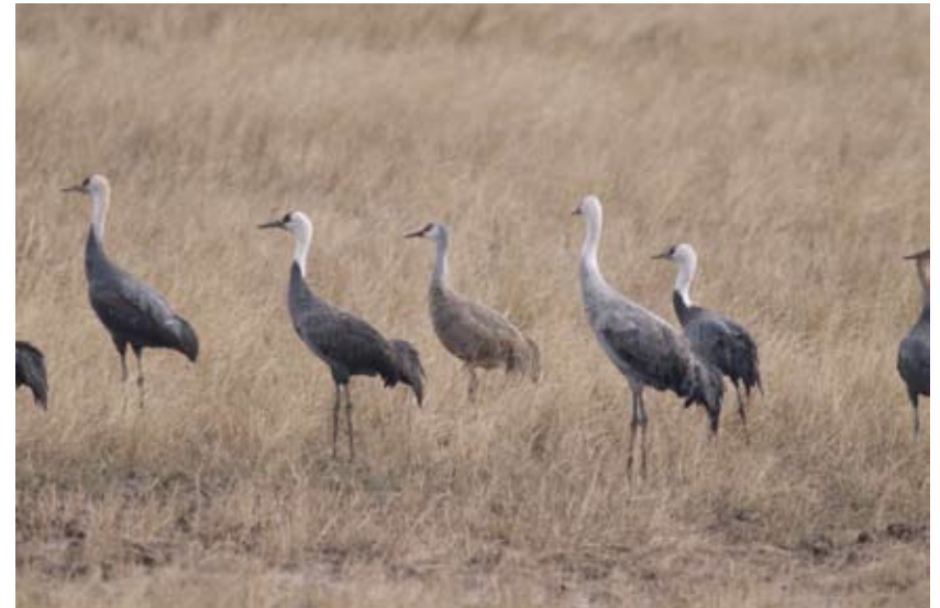
0300# 沙丘鹤 Sandhill Crane Grus canadensis 2006-2-24, 上海崇明东滩, Dongtan NR, Chongming, Shanghai