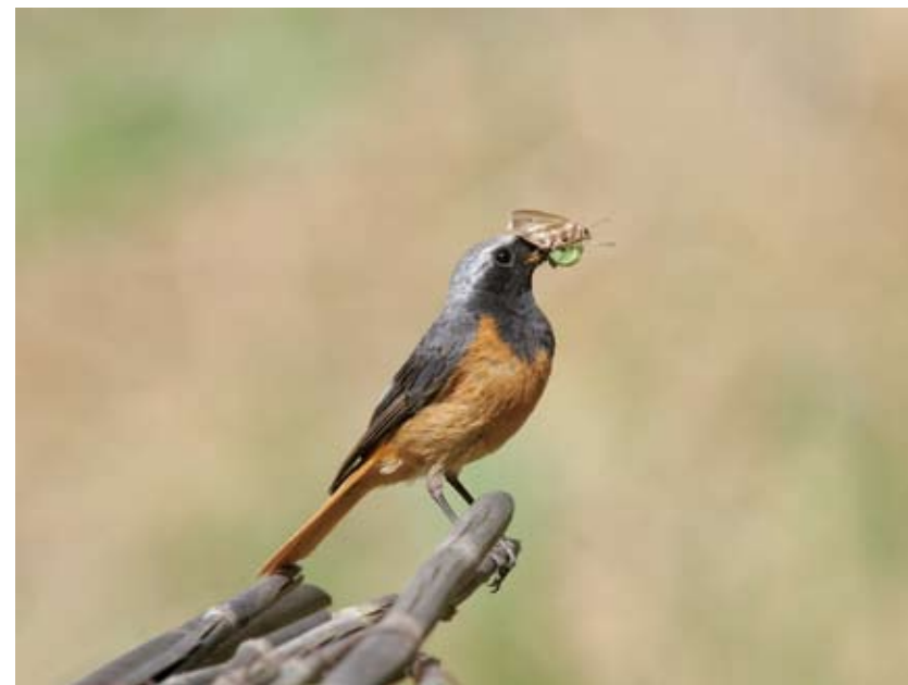
0785# 黑喉红尾鹟 Hodgson's Redstart Phoenicurus hodgsoni 2006-8-1, 青海班玛玛河林场, Makehe FF, Banma, Qinghai