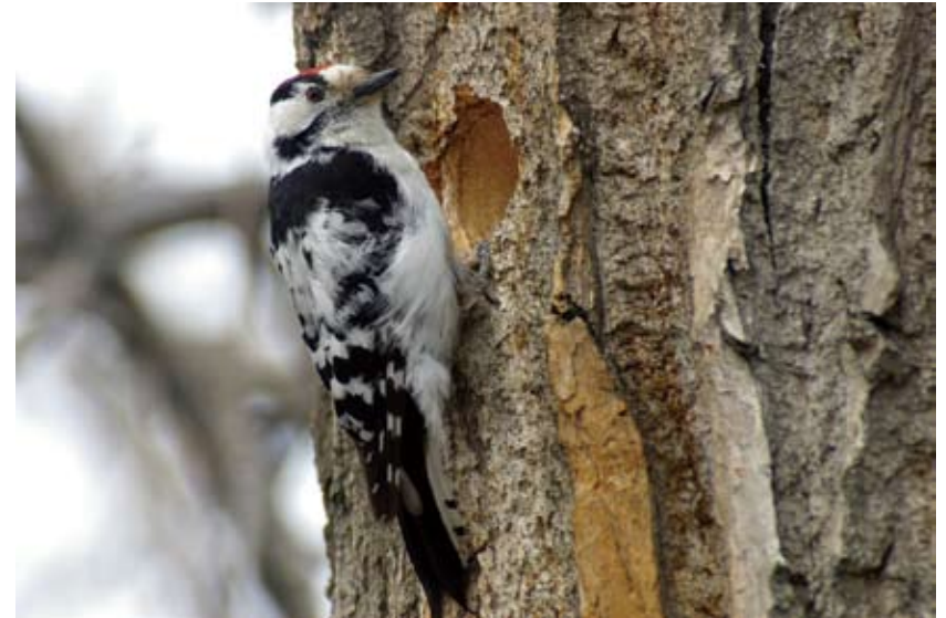
0124# 小斑啄木鸟 Lesser Spotted Woodpecker Dendrocopos minor 2006-5-6, 新疆富蕴可可托海, Keketuohai, Fuyun, Xinjiang