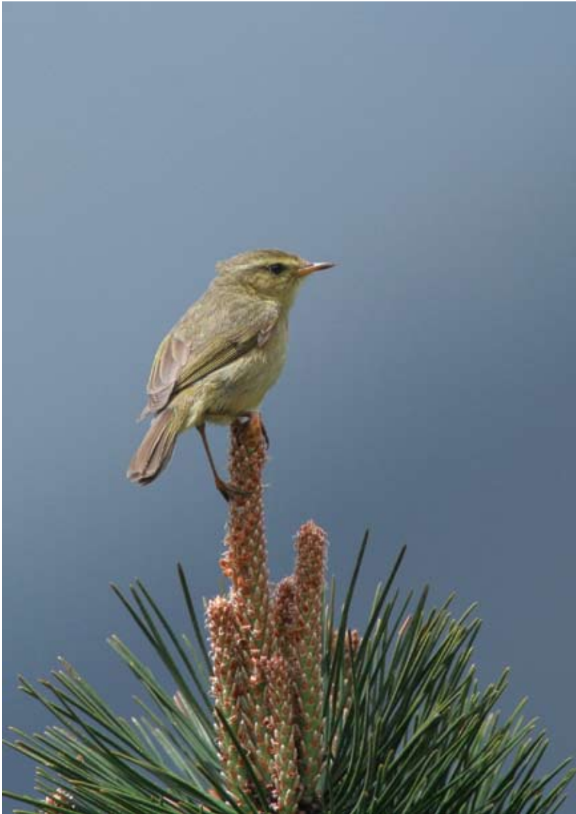
0978# 棕腹柳莺 Buff-throated Warbler Phylloscopus subaffinis 2006-5-4, 福建武夷山保护区, Wuyi Shan NR, Fujian