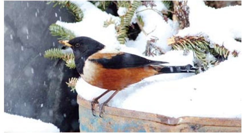
0710# 棕背黑头鸫 Kessler's Thrush Turdus kessleri 2006-4-14, 四川甘孜雅江, Yajiang, Ganzi, Sichuan