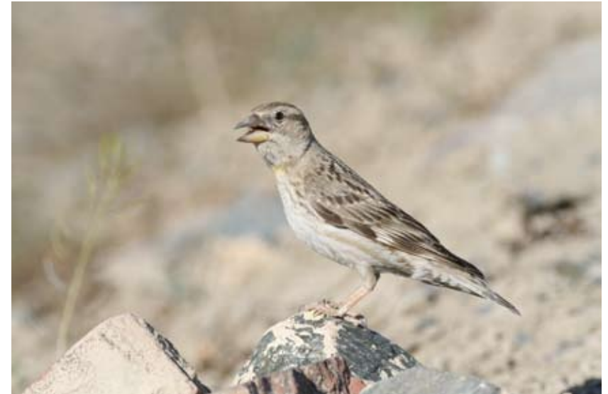
1199# 石雀 Rock Sparrow Petronia petronia 2006-5-29, 新疆独山子, Dushanzi, Xinjiang