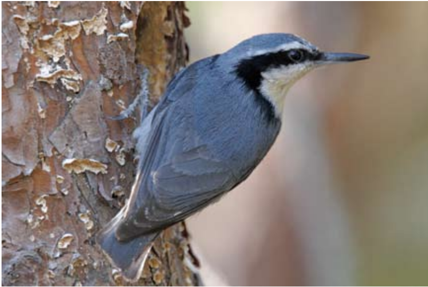
0837# 滇鹛 Yunnan Nuthatch Sitta yunnanensis 2006-3-31, 云南剑川石宝山, Shibao Shan, Jianchuan, Yunnan