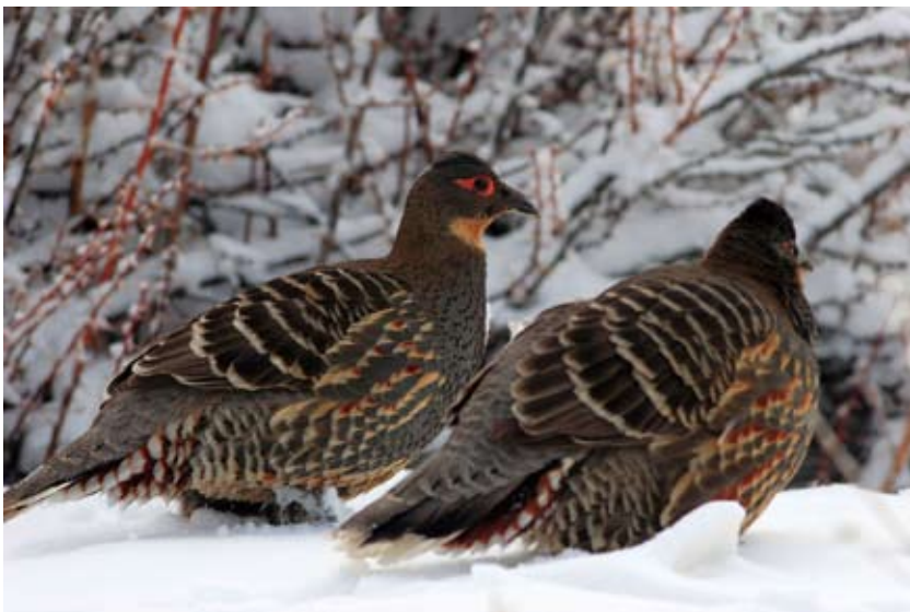
0006# 四川雉鹑 Buff-throated Partridge Tetraophasis szechenyi 2006-4-15, 四川甘孜雅江, Yajiang, Ganzi, Sichuan