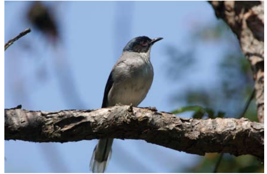
1123# 黑头奇鹛 Black-headed Sibia Heterophasia desgodinsi 2006-9-30, 云南巍山, Weishan, Yunnan