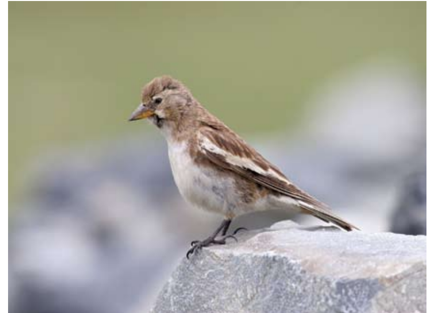
1200# 白斑翅雪雀 White-winged Snowfinch Montifringilla nivalis 2006-8-3, 青海兴海鄂拉山口, Er La Pass, Xinghai, Qinghai