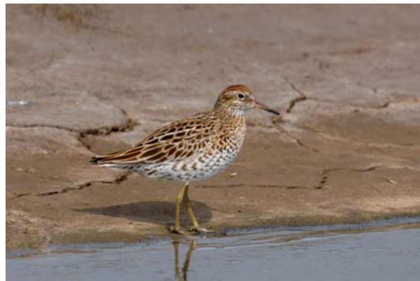
0369# 尖尾滨鹬 Sharp-tailed Sandpiper Calidris acuminata 2006-4-28, 天津北塘, Beitang, Tianjin