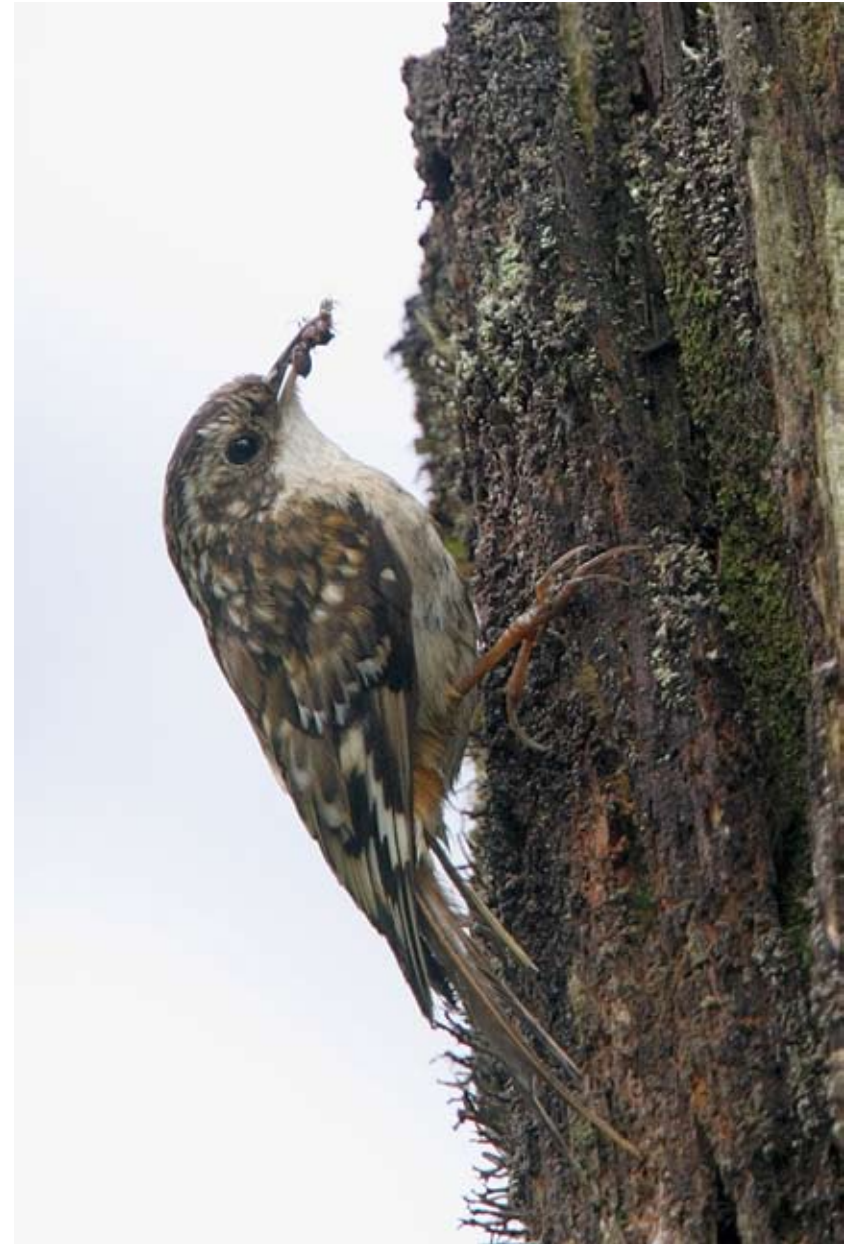
0844.2# 四川旋木雀 Sichuan Treecreeper Certhia tianquanensis 2006-6-5, 四川洪雅瓦屋山, Wawu Shan, Hongya, Sichuan