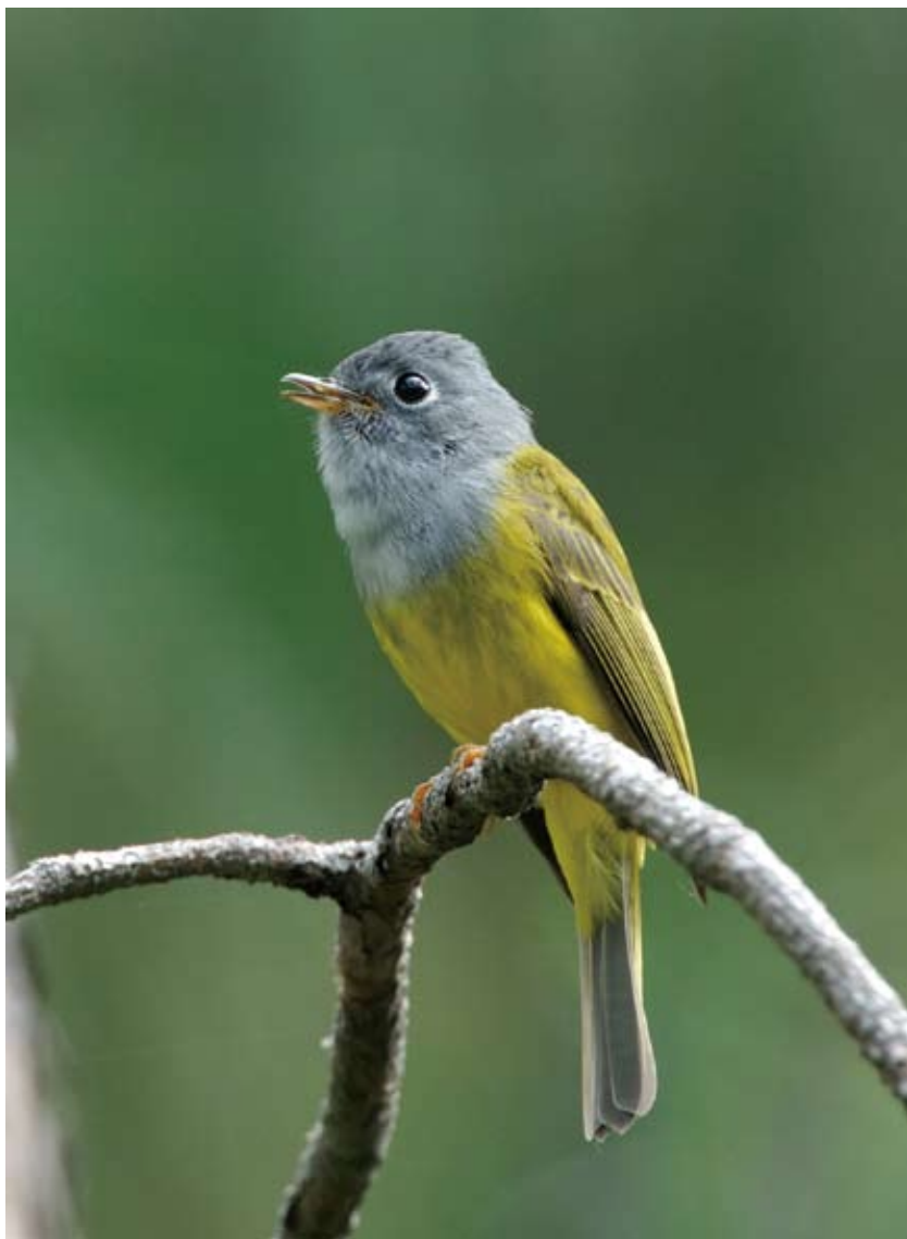
0759# 方尾鹟 Grey-headed Canary Flycatcher Culicicapa ceylonensis 2006-10-2, 云南巍山, Weishan, Yunnan