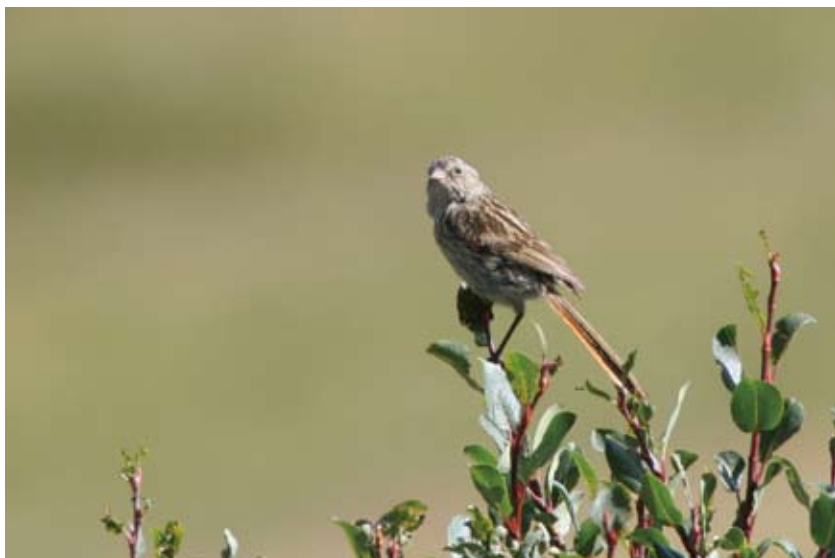
1299# 朱鹀 Przevalski's Bunting Urocynchramus pylzowi 2006-8-5, 青海共和橡皮山, Rubber Mountain, Gonghe, Qinghai