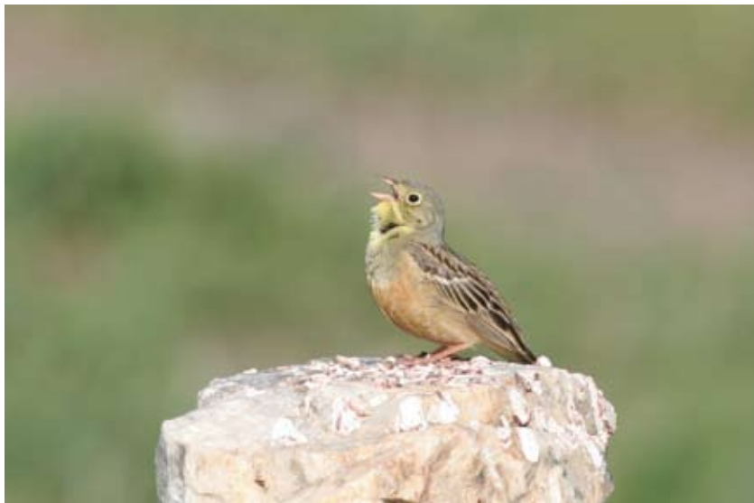
1310# 圖鹀 Ortolan Bunting Emberiza hortulana 2006-6-12, 新疆喀纳斯湖, Kanasi Hu, Xinjiang