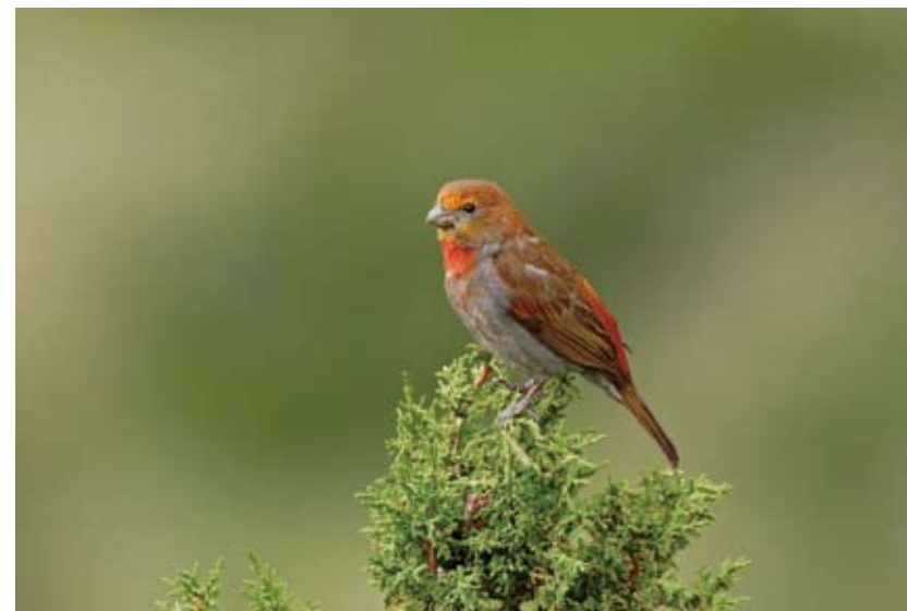
1284# 红眉松雀 Crimson-browed Finch Propyrrhula subhimachala 2006-8-21, 西藏芒康, Markham, Tibet