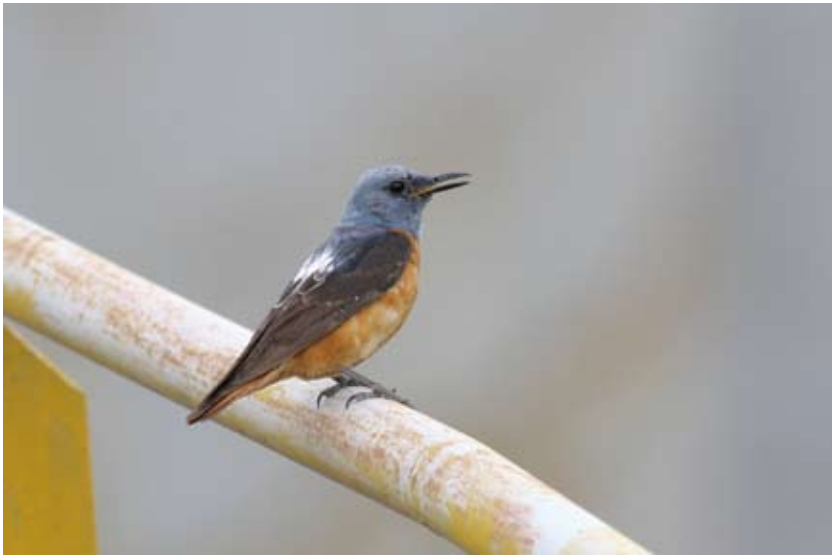
0689# 白背矶鸫 Rufous-tailed Rock Thrush Monticola saxatilis 2006-6-14, 新疆独山子, Dushanzi, Xinjiang