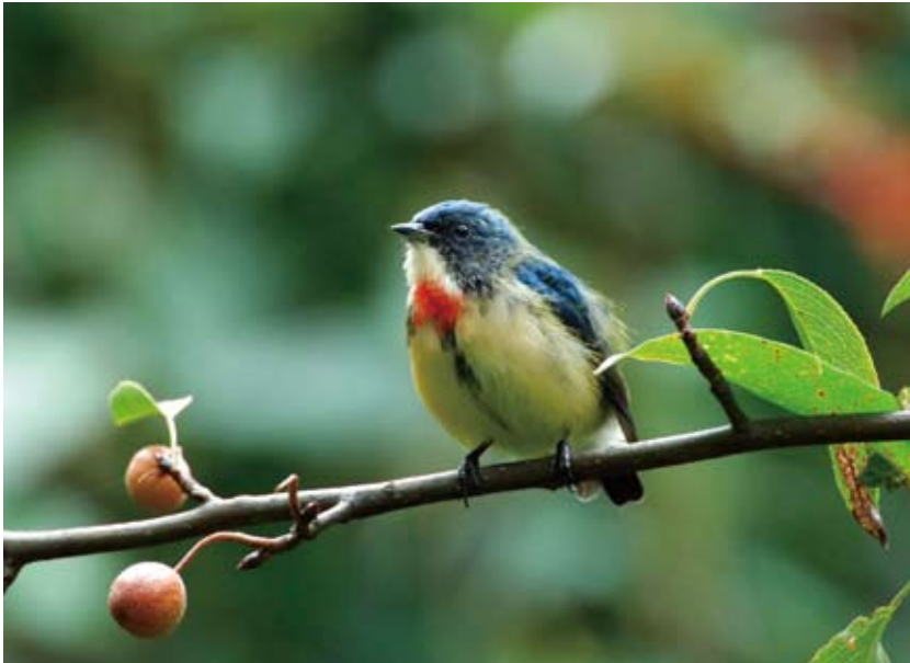
1180# 红胸啄花鸟 Fire-breasted Flowerpecker Dicaeum ignipectus 2006-12-6, 云南巍山, Weishan, Yunnan