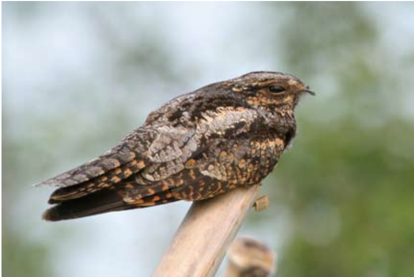
0257# 普通夜鹰 Grey Nightjar Caprimulgus indicus 2006-9-2, 浙江杭州下沙, Xiasha, Hangzhou, Zhejiang