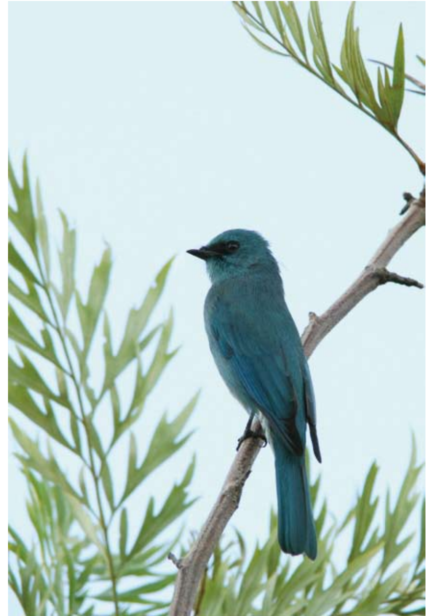
0746# 铜蓝鹇 Verditer Flycatcher Eumyias thalassina 2006-9-30, 云南巍山, Weishan, Yunnan