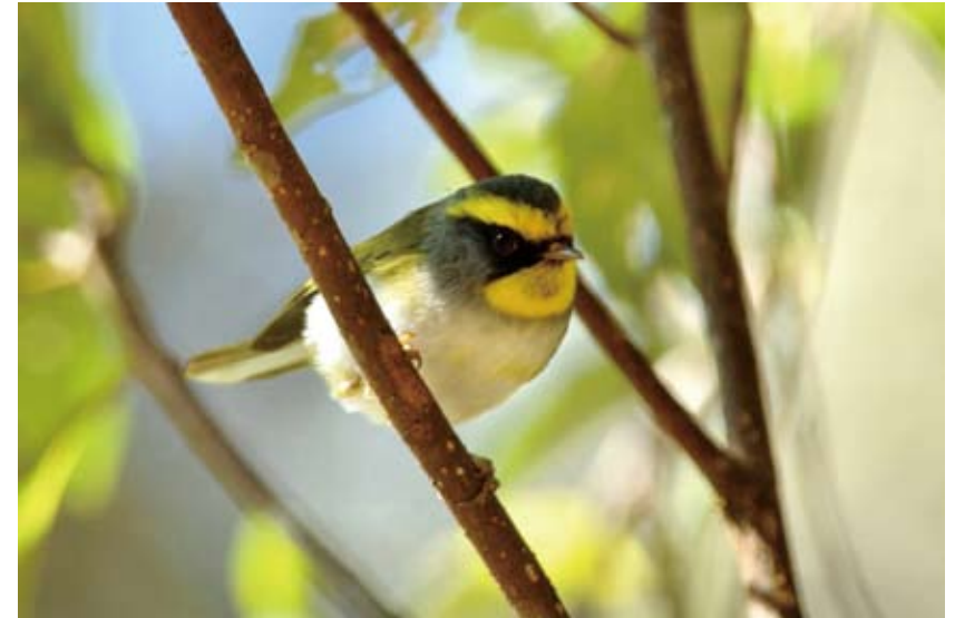
1009# 黑脸鹟莺 Black-faced Warbler Abrosopus schisticeps 2006-1-27, 云南屏边大围山, Dawei Shan, Pingbian, Yunnan