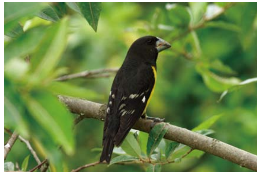
1296# 白点翅拟蜡嘴雀 Spot-winged Grosbeak Mycerobas melanozanthos 2006-7-31, 西藏日喀则亚东, Yadong, Xigaze, Tibet