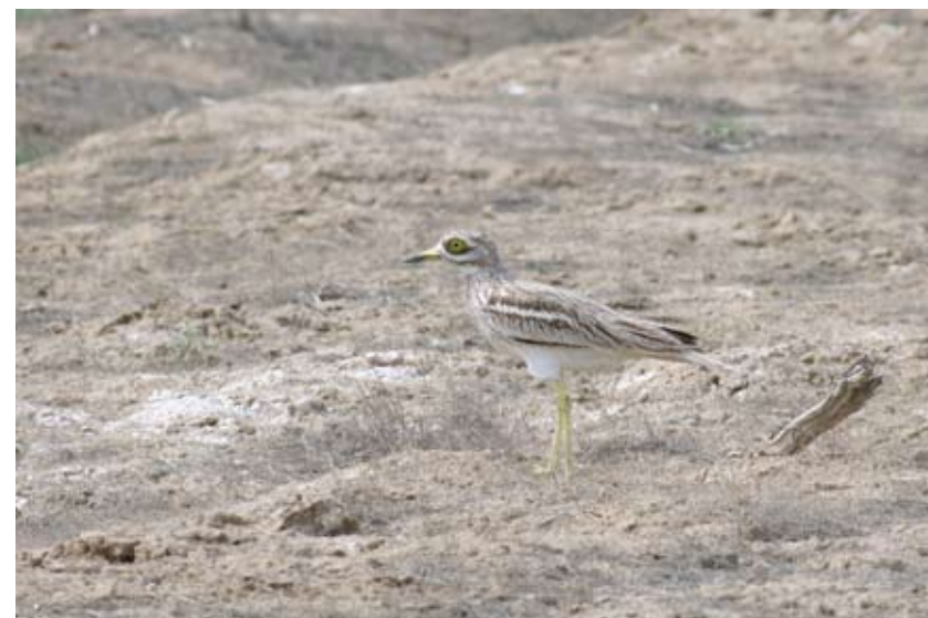
0382# 欧石鸻 Eurasian Thick-knee Burbinus oedicnemus 2006-6-10, 新疆克拉玛依五五新镇, Wuwuxinzhèn, Karamay, Xinjiang