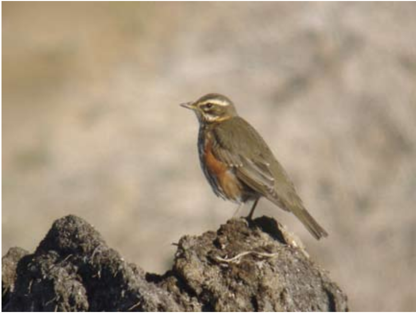
0719# 白眉歌鸲 Redwing Turdus iliacus 2006-10-23, 新疆富蕴喀木斯特, Kamusite, Fuyun, Xinjiang