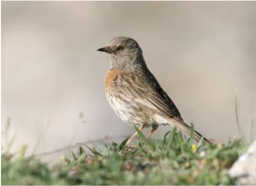
1228# 鸚岩鸚 Robin Accentor Prunella rubeculoides 2006-8-5, 青海共和橡皮山, Rubber Mountain, Gonghe, Qinghai