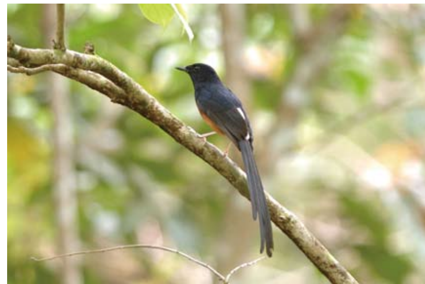
0779# 白腰鹊鸂 White-rumped Shama Copsychus malabaricus 2006-3-29, 云南西双版纳热带植物园, Xishuangbanna Tropical Botanical Garden, Yunnan