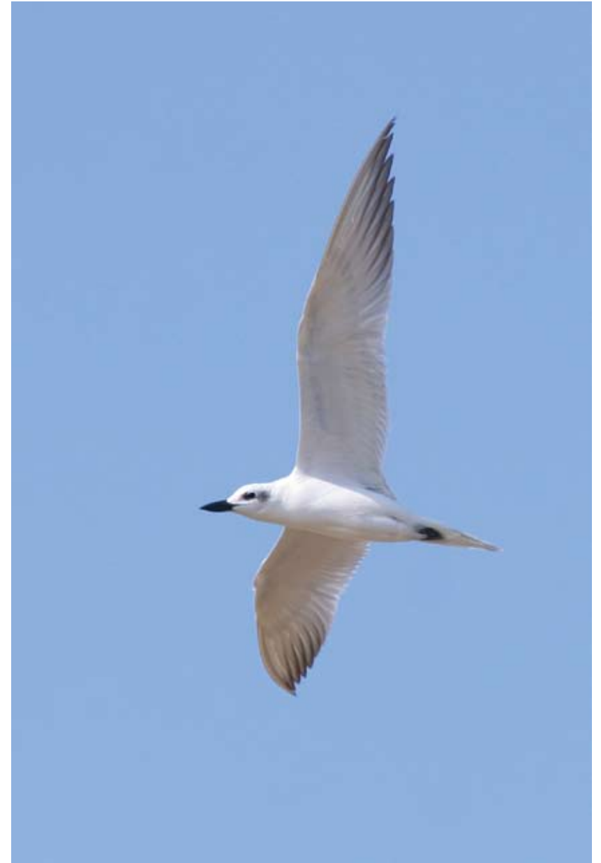
0432# 鸥嘴噪鸥 Gull-billed Tern Gelochelidon nilotica 2006-9-24, 上海南汇滨海, Binhai, Nanhui, Shanghai