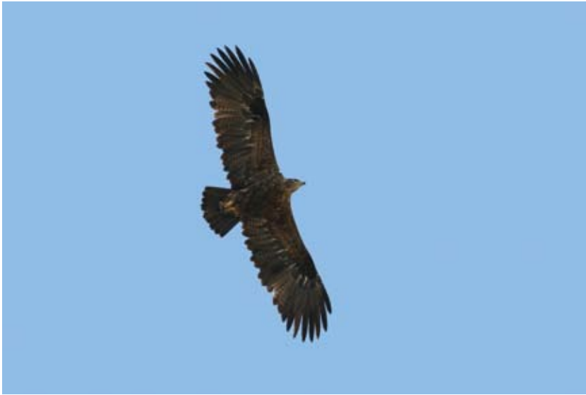
0498# 草原雕 Steppe Eagle Aquila nipalensis 2006-10-3, 新疆克拉玛依白碱滩, Baijiantan, Karamay, Xinjiang