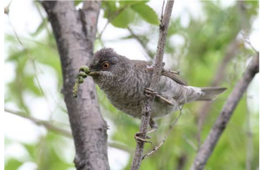
1161# 横斑林莺 Barred Warbler Sylvia nisoria 2006-6-10, 新疆克拉玛依五五新镇, Wuwuxinzen, Karamay, Xinjiang