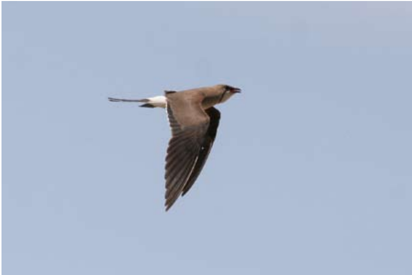
0404# 领燕鸥 Collared Pratincole Glareola pratincola 2006-6-8, 新疆五家渠青格达湖, Qinggeda Hu, Wujiaqu, Xinjiang