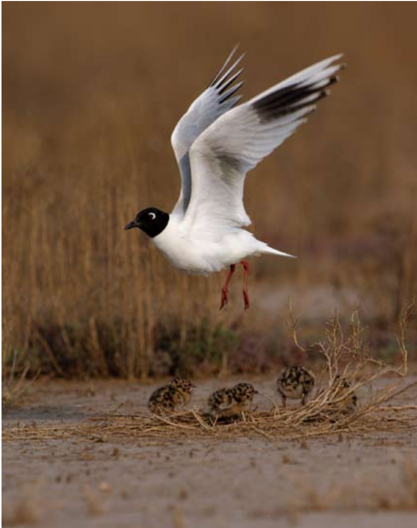
0426# 黑嘴鸥 Saunders' s Gull Larus saundersi 2006-6-23, 辽宁盘锦, Panjin, Liaoning