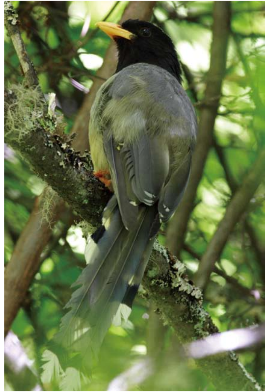
0625# 黄嘴蓝鹊 Yellow-billed Blue Magpie Urocissa flavirostris 2006-7-31, 西藏林芝米林, Milin, Nyingchi, Tibet