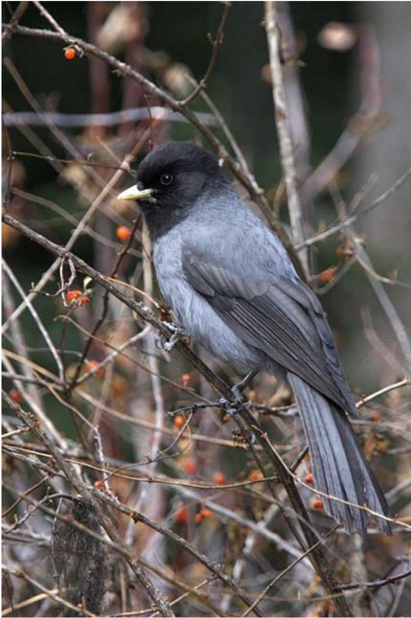
0623# 黑头噪鸦 Sichuan Jay Perisoreus internigrans 2006-11-17, 四川梦笔山, Mengbi Shan, Sichuan