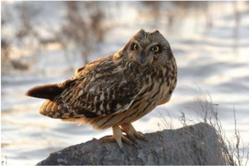
0254# 短耳鸮 Short-eared Owl Asio flammeus 2006-11-14, 山东东营黄河三角洲, Yellow River Estuary, Dongying, Shandong