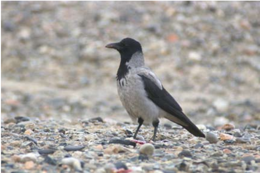
0647.2# 西小嘴乌鸦 Hooded Crow Corvus cornix 2006-11-28, 新疆乌什县农一师四团, Nongyishi, Wushi, Xinjiang