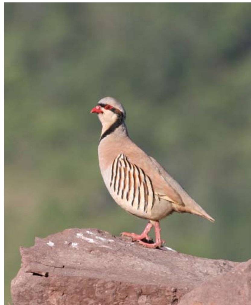
0007# 石鸡 Chukar Alectoris chukar 2006-5-27, 山西吉县, Jixian, Shanxi