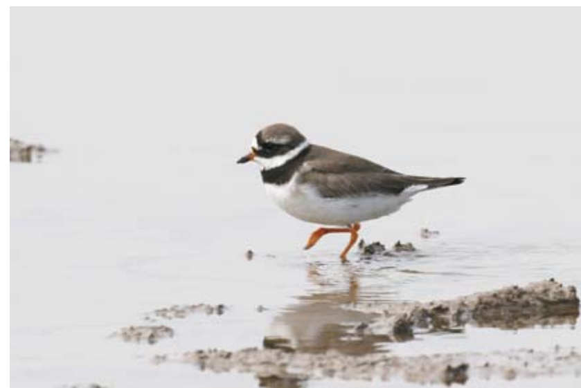
0390# 剑鸻 Common Ringed Plover Charadrius hiaticula 2006-4-5, 上海南汇滨海, Binhai, Nanhui, Shanghai