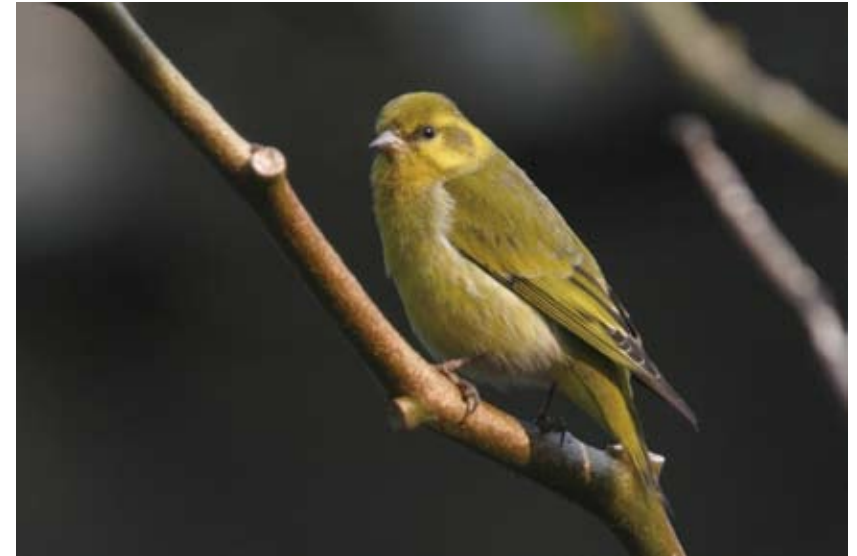
1250# 藏黄雀 Tibetan Serin Carduelis tibetana 2006-5-24, 云南腾冲来凤山, Laifeng Shan, Tengchong, Yunnan