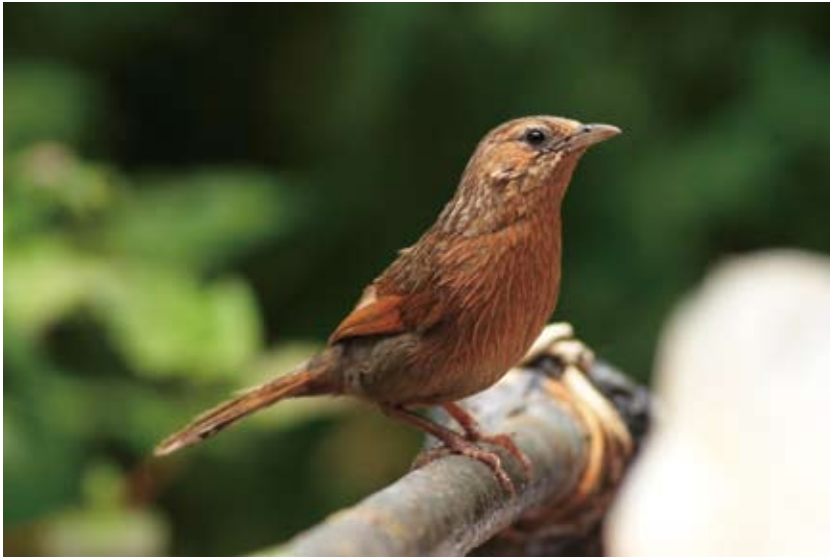
1038# 细纹噪鹛 Streaked Laughingthrush Garrulax lineatus 2006-8-13, 西藏日喀则聂拉木, Nyalam, Xigaze, Tibet