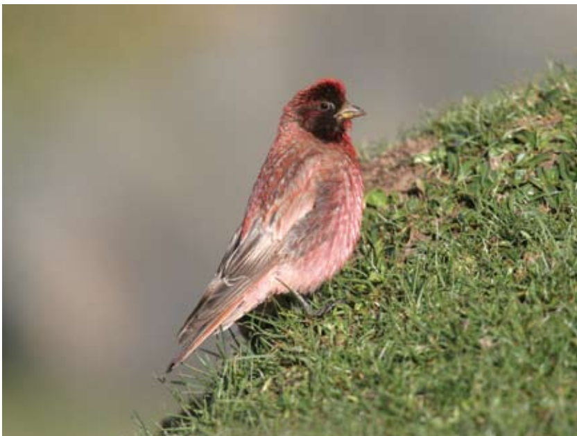
1282# 藏雀 Roborovski's Rosefinch Carpodacus roborowskii 2006-8-4, 青海兴海鄂拉山口, Er La Pass, Xinghai, Qinghai