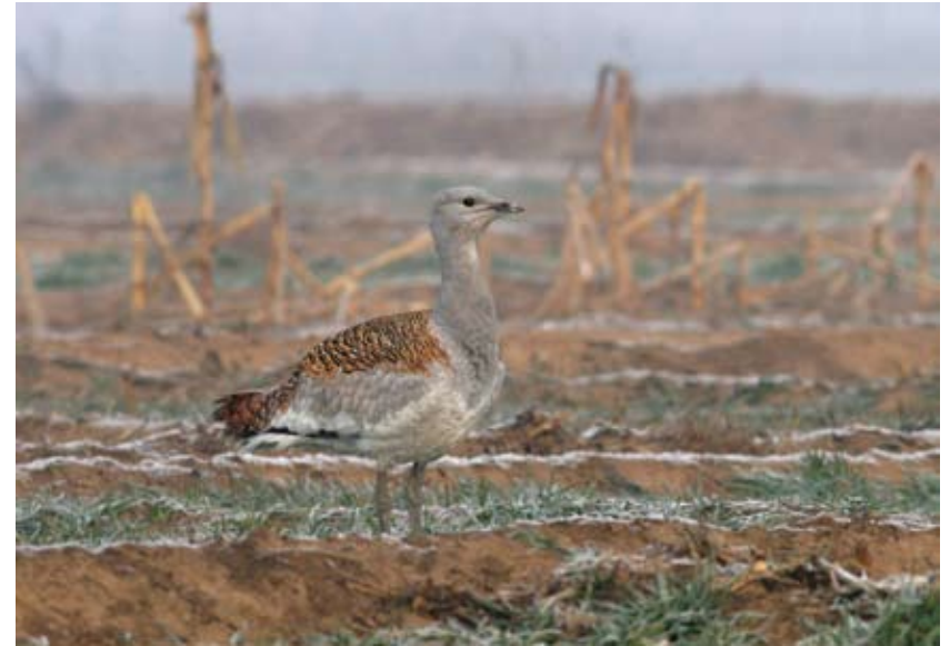
0295# 大鸨 Great Bustard Otis tarda 2006-12-26, 山东莱州, Laizhou, Shandong