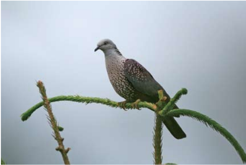
0269# 点斑林鸽 Speckled Wood Pigeon Columba hodgsonii 2006-7-23, 西藏亚东, Yadong, Tibet