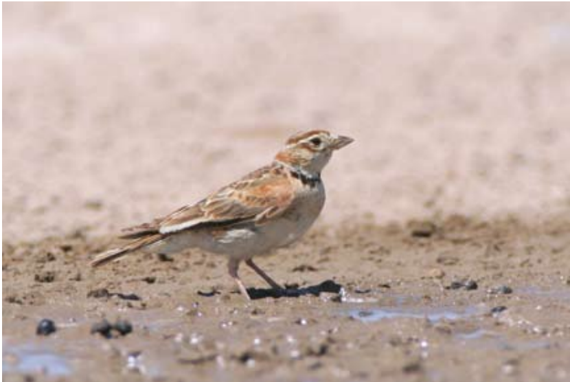
1165# 蒙古百灵 Mongolian Lark Melanocorypha mongolica 2006-8-5, 青海共和, Gonghe, Qinghai