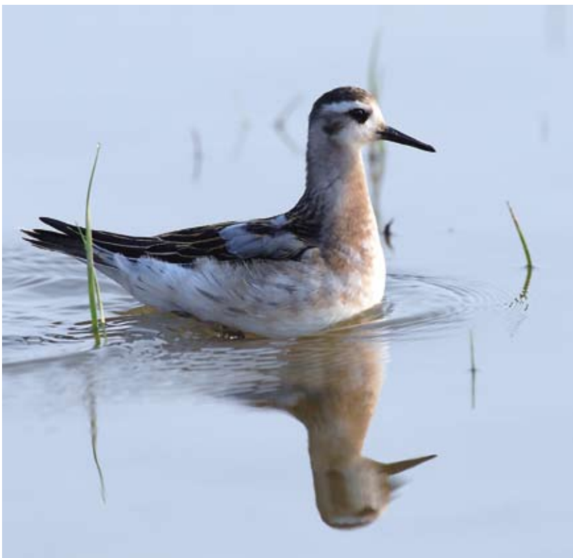
0378# 灰瓣蹼鹬 Red Phalarope Phalaropus fulicaria 2006-9-17, 山西广灵, Guangling, Shanxi