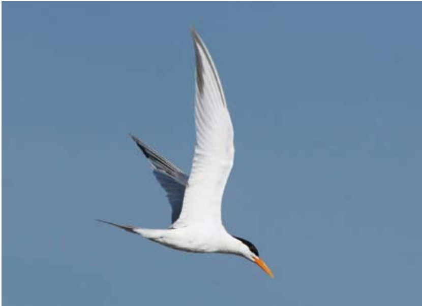
0435# 小凤头燕鸥 Lesser Crested Tern Thalasseus bengalensis 2006-7-1, 福建长乐闽江口, Min Jiang Estuary, Changle, Fujian