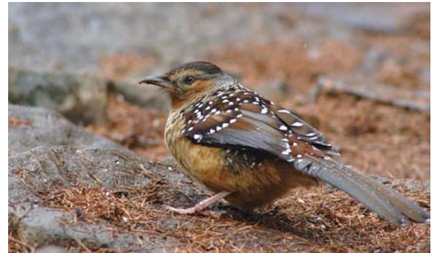
1031# 大噪鹛 Giant Laughingthrush Garrulax maximus 2006-4-14, 四川甘孜雅江, Yajiang, Ganzi, Sichuan