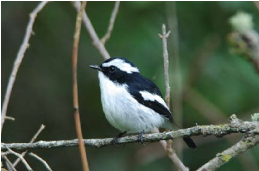
0741# 小斑姬鹇 Little Pied Flycatcher Ficedula westermanni 2006-10-1, 云南巍山, Weishan, Yunnan