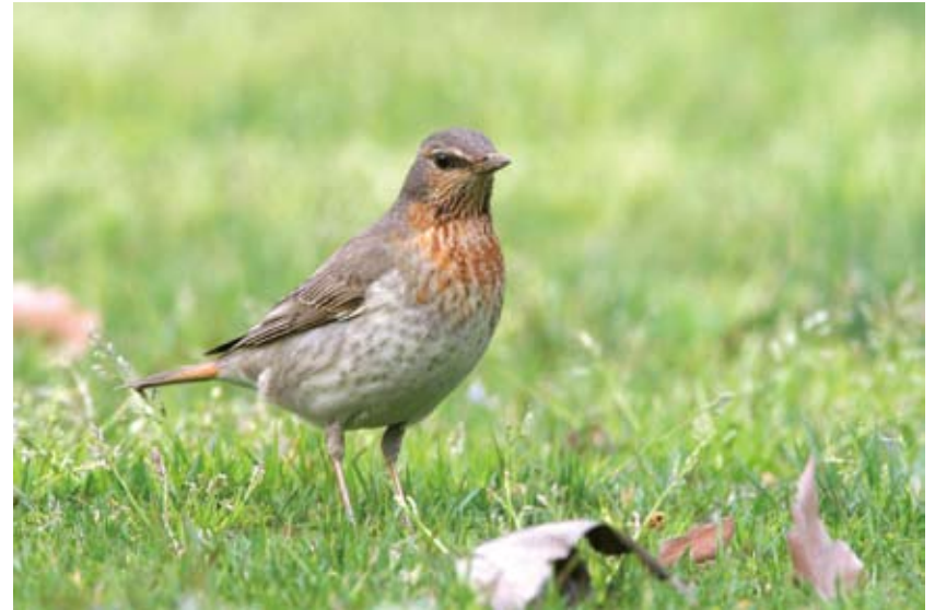
0716.1# 赤颈鸫 Red-throated Thrush Turdus ruficollis 2006-3-19, 浙江杭州西湖, Xi Hu, Hangzhou, Zhejiang