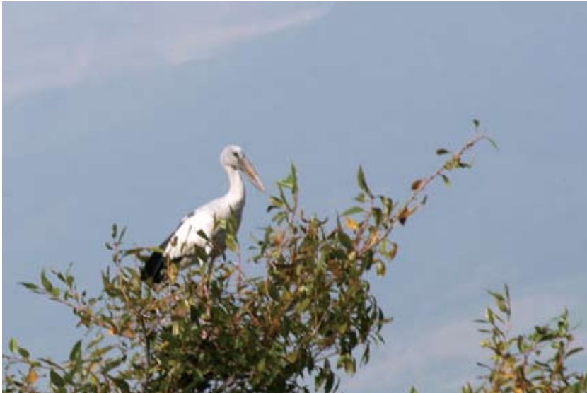
0567.a# 钳嘴鹳 Asian Openbill Anastomus oscitans 2006-10-3, 云南大理, Dali, Yunnan