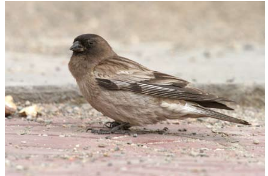
1257# 高山岭雀 Brandt's Mountain Finch Leucosticte brandti 2006-8-3, 青海玛多花石峡, Huashixia, Maduo, Qinghai