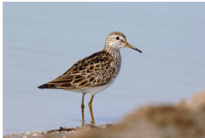
0368# 斑胸滨鹬 Pectoral Sandpiper Calidris melanotos 2006-4-28, 天津北塘, Beitang, Tianjin