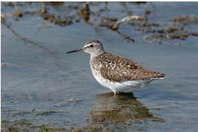
0349# 林鹬 Wood Sandpiper Tringa glareola 2006-5-13, 天津北塘, Beitang, Tianjin