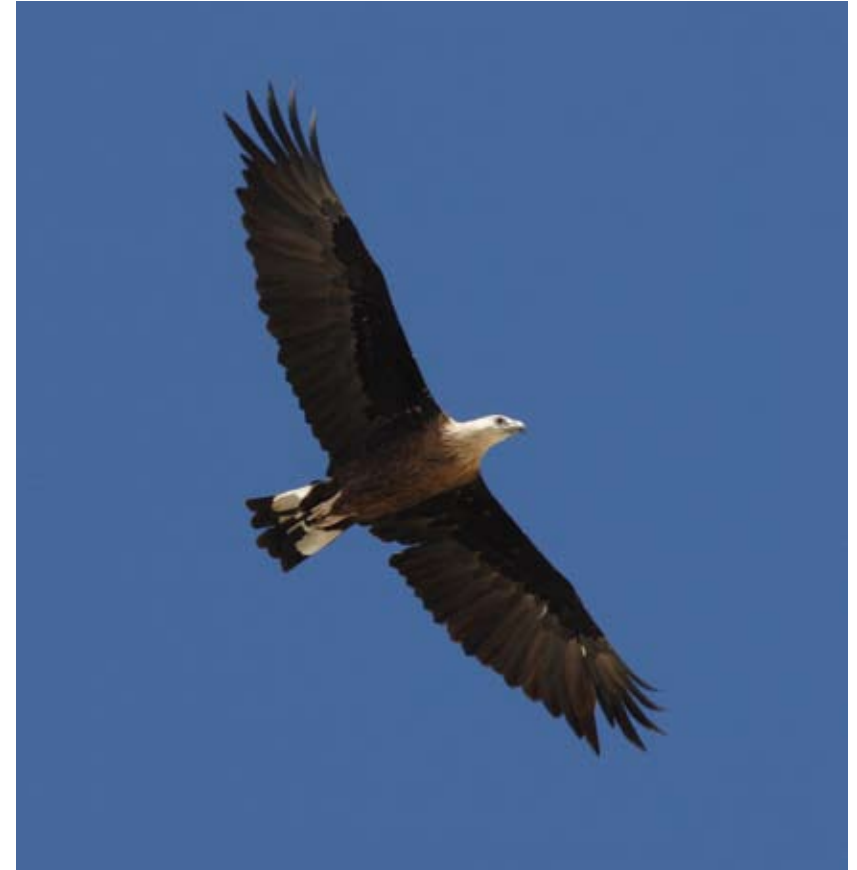
0464# 玉带海雕 Pallas' s Fish Eagle Haliaeetus leucoryphus 2006-7-31, 西藏日喀则通门, Tongmen, Xikaze, Tibet