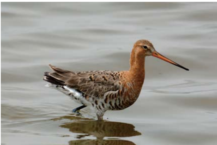
0336# 黑尾塍鹬 Black-tailed Godwit Limosa limosa 2006-5-6, 天津北塘, Beitang, Tianjin