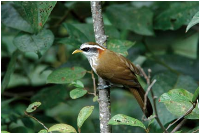
1059.1# 棕颈钩嘴鹛 Streak-breasted Scimitar Babbler Pomatorhinus ruficollis 2006-10-1, 云南巍山, Weishan, Yunnan