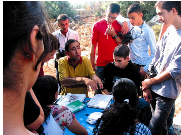
BirdLife in Palestine

通过由美国国际开发援助署 (United States Aid for International Development) 资助、自来水及灌溉部门转给皇家自然保育协会承包的其中一项计划 - 水功效和公众资料行动计划 (Water efficiency and Public Information for Action), 我们接触了传统的学校课程。这个关于水的教育计划开展于 2000 年, 目的是想把水的管理融合于国家的教育课程之中。我们不但建立了一个全面、让学生具备环境技巧和令他们成为改变习惯的中介人的传统教育计划, 而且教育学者亦检阅了 200 本教科书和评价了当中的水的教育部份。为了改善水的教育, 我们筹备了新的、针对家中和全国的用水正确行为的水的管理课堂。管理水资源着重于成立保护区以保护湿地、水面、海水和生物多样性。