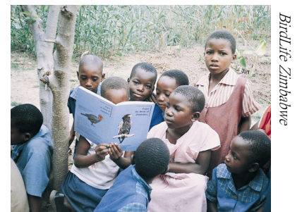
国际鸟盟津巴布韦分会的学校教育工作令很多儿童对鸟类产生兴趣。