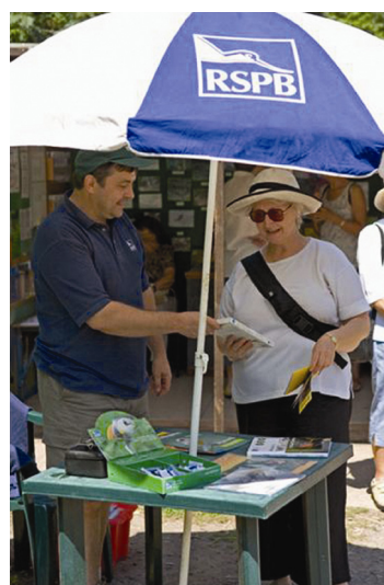
志愿者主动向到访者介绍鸟类书籍。