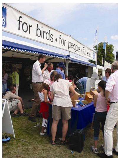
人工鸟巢的展览很受欢迎。