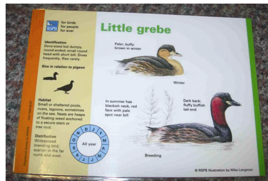
英国皇家鸟类保护协会的鸟类辨认配对游戏。