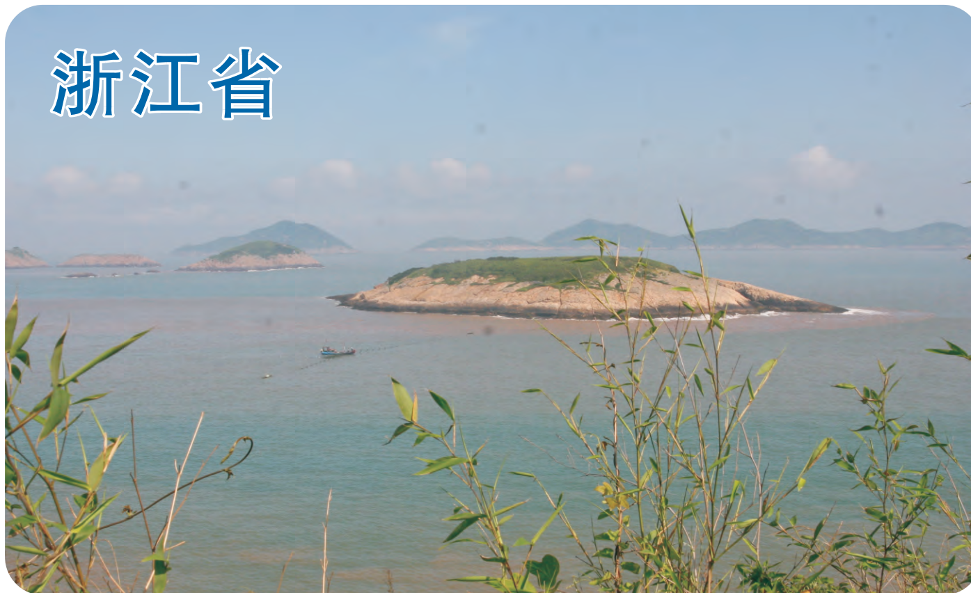
韭山列岛（第387号重点鸟区）是燕鸥的繁殖地，也是世界上两处黑嘴端凤头燕鸥的繁殖地之一，但受到不法拣拾鸟蛋的危害。