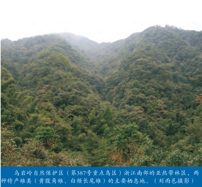
乌岩岭自然保护区（第387号重点鸟区）浙江南部的亚热带林区，两种特产雉类（黄腹角雉、白颈长尾雉）的主要栖息地。