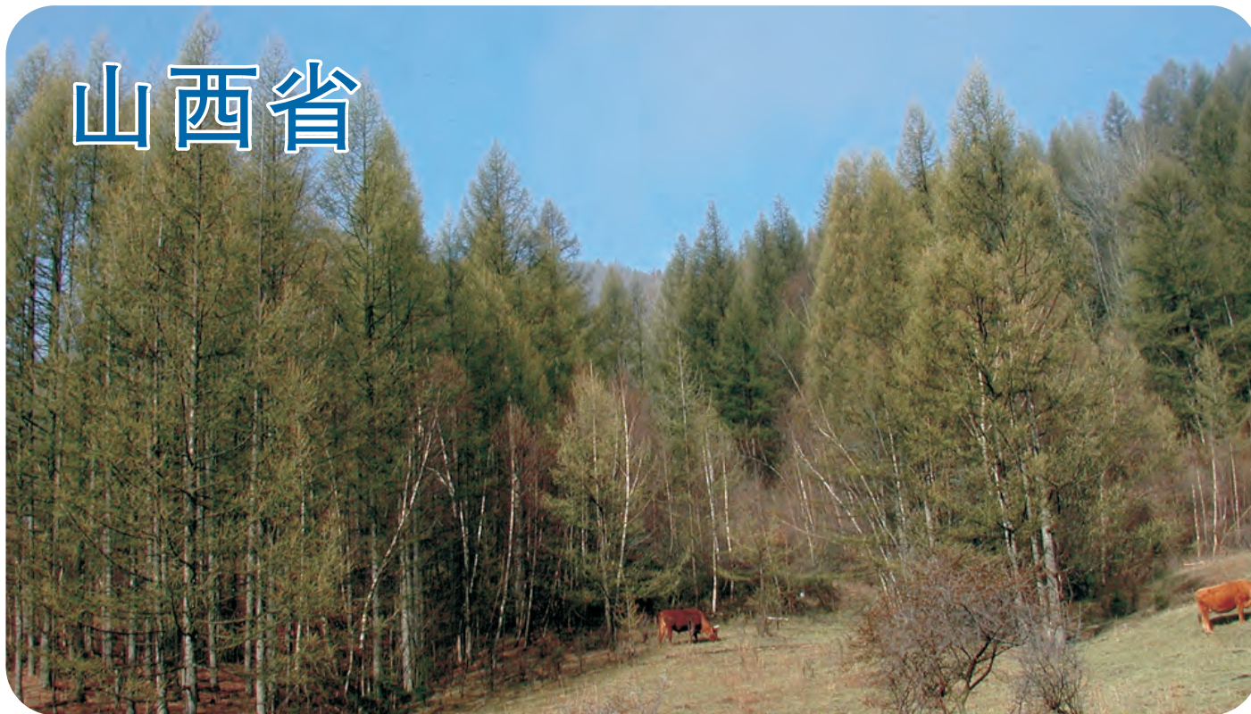
庞泉沟（第306号重点鸟区）所在的晋冀山区，是罕有的北方特有鸟区，也是褐马鸡的主要产地。