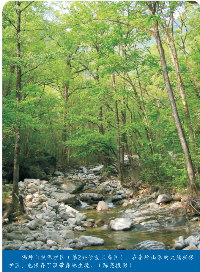
佛坪自然保护区（第298号重点鸟区），在秦岭山系的大熊猫保护区，也保存了温带森林生境。