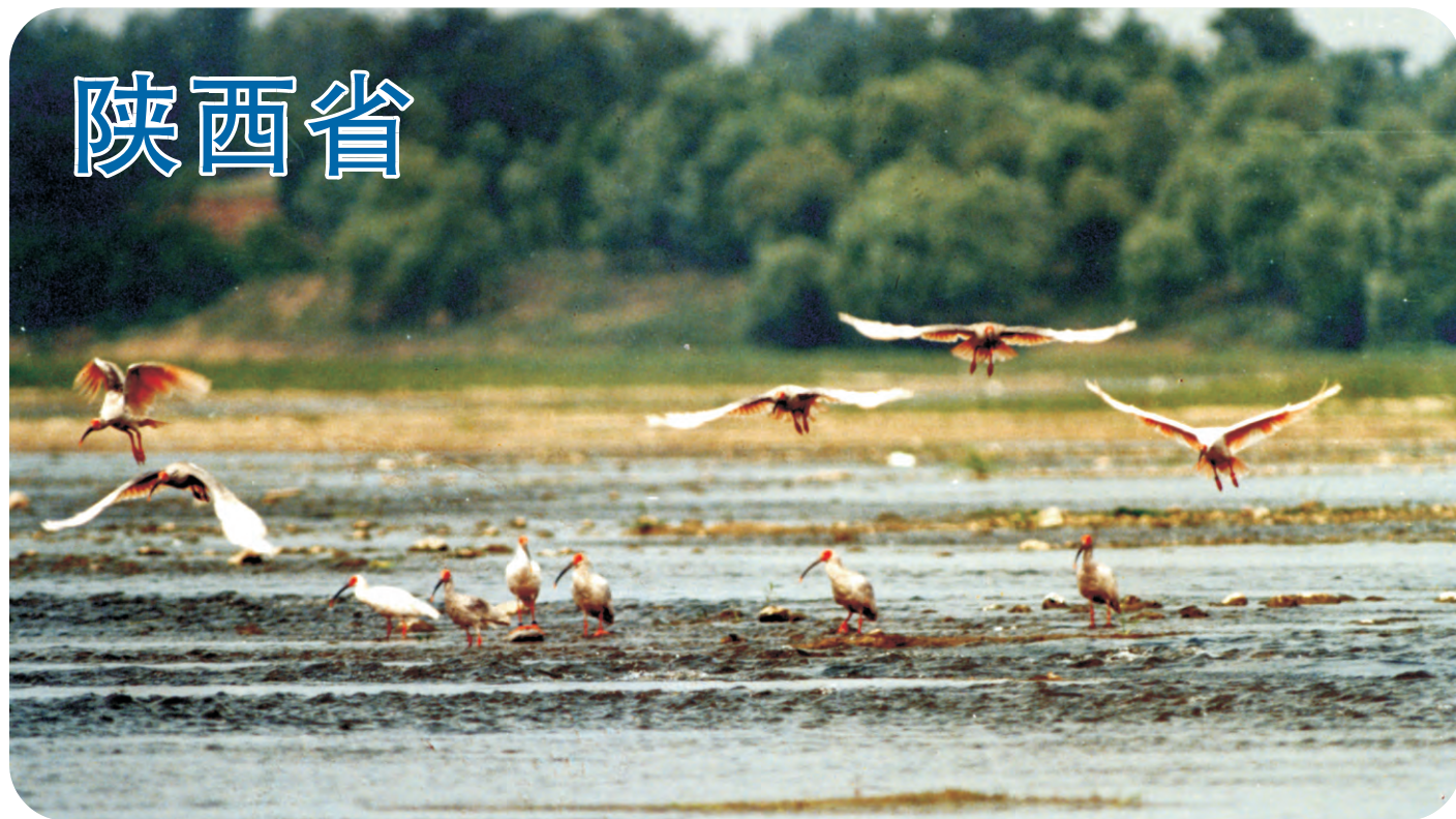
洋县的朱鹮分布地（第300号重点鸟区），世界上唯一的野生朱鹮群体，从1981年的7只经悉心保护后增加到几百只，令朱鹮逃离了绝种的厄运。