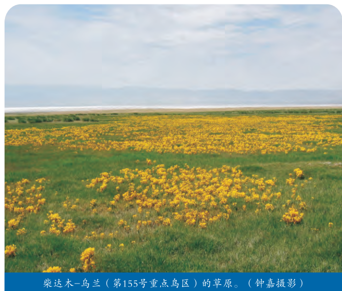
柴达木-乌兰（第155号重点鸟区）的草原。

其它重要动植物简述：曾有棕熊、猞猁、鹤喉羚及盘羊等，但现在数量已比20世纪70年代明显减少