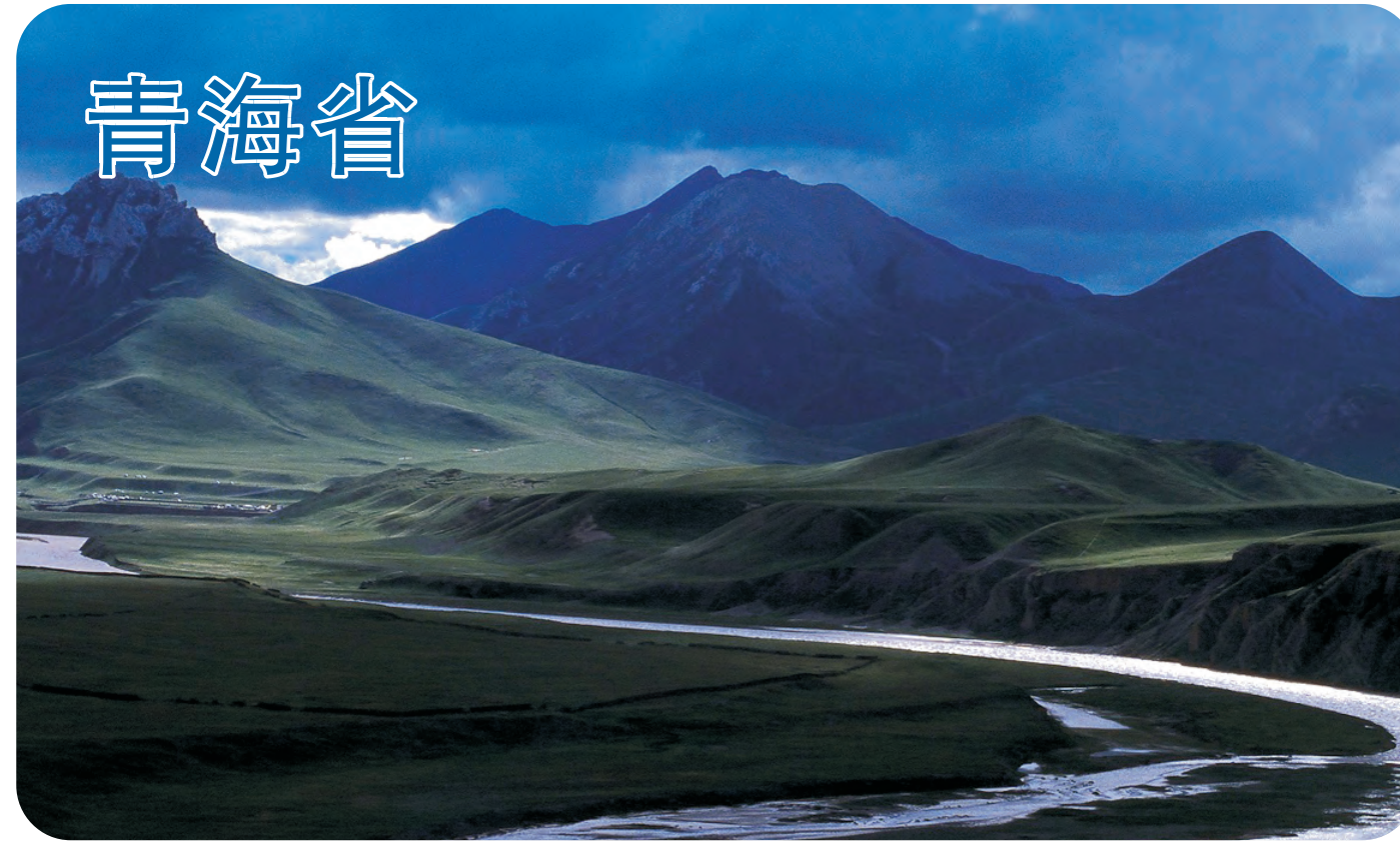
三江源（第154号重点鸟区），是亚洲三大河流（黄河、长江、澜沧江—湄公河的上游）的源头。