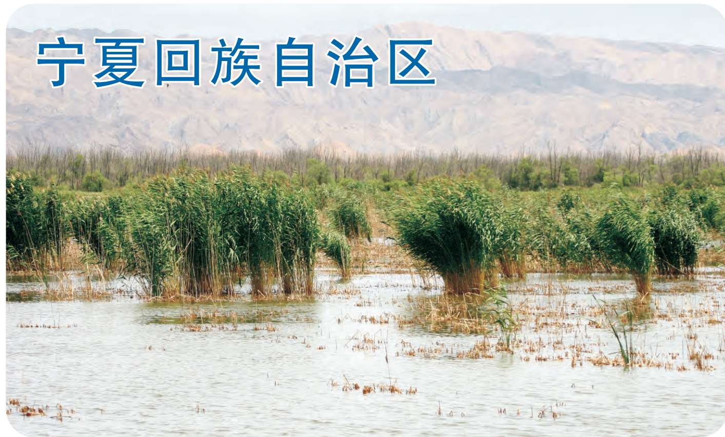
青铜峡水库（第175号重点鸟区），黄河上游的一片富饶湿地。