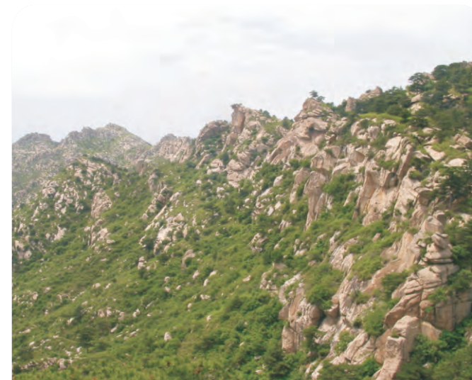
医巫闾山（第051号重点鸟区），是满语“翠绿的”的意思，除了是国家级的自然保护区，也是辽宁的一个著名风景旅游区。

● 区内分布数量超过东亚种群1%的鸟类：东方白鹳（迁徙季节最多可见多达380只）、鸿雁（迁徙期间可见多达1,500只的大群）、豆雁、赤麻鸭、翘鼻麻鸭、白鹤（1996年10月下旬记录到440只）、丹顶鹤（1998年估计该区的繁殖种群约50余只，迁徙种群约达500只）、黑嘴鸥（1991年记录到超过1,000只）、大滨鹬（1998、1999年间春季迁徙的统计最大数为24,915只——录自Barter 2002；以下鹤鹑类数据同，如未指明季节，则数据为春秋迁徙的最大记录数量）、黑腹滨鹬（春季16,411只，秋季7,600只）、灰斑鹤（4,248只）、斑尾塍鹬（3,738只）、大杓鹬（春季1,803只、秋季1,817只）、白腰杓鹬（春季1,535只、秋季700只）、环颈鸪（1,367只）、中杓鹬（1,306只）、蛎鹬（春季100只、秋季500只）、红腹滨鹬（秋季4,200只）、黑尾塍鹬（秋季2,070只）、翘嘴鹬（秋季1,200只）