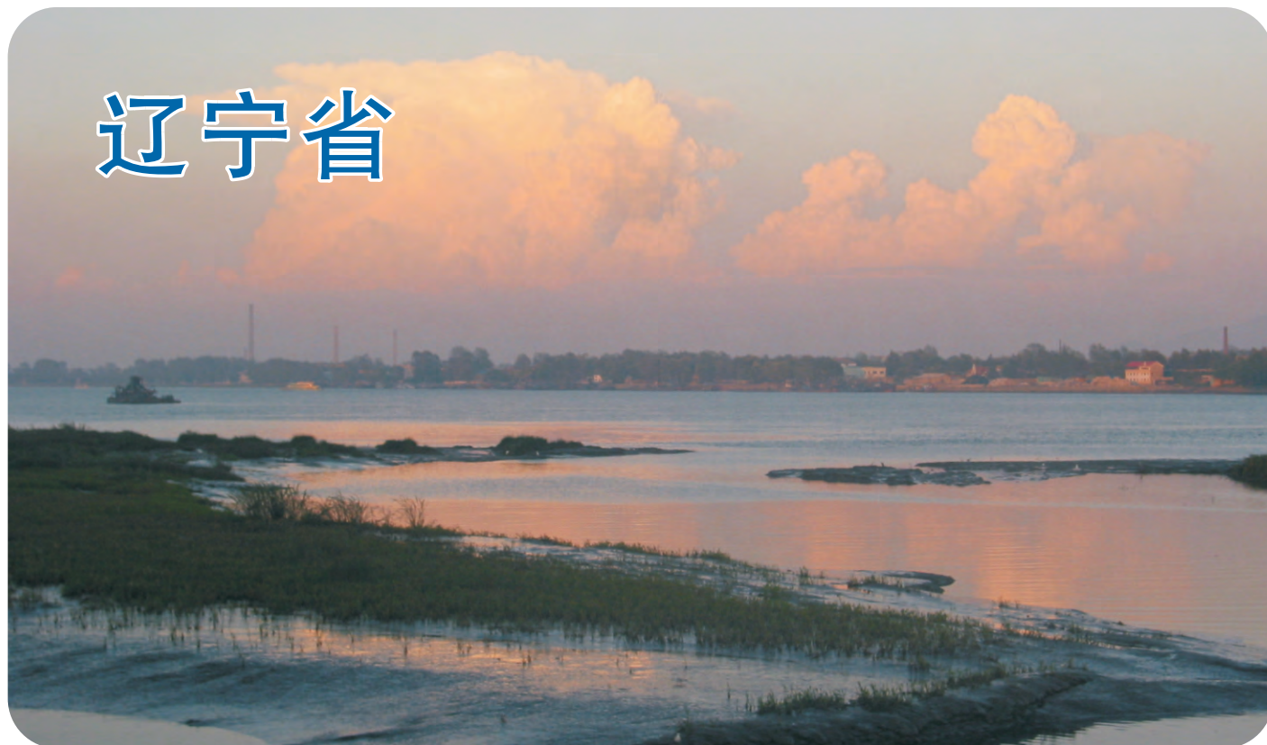
鸭绿江口（第062号重点鸟区）附近的沼泽，这片中朝国境之间的湿地，每年在迁徙季节有以十万计的鹤鹑类及其他水鸟过境。