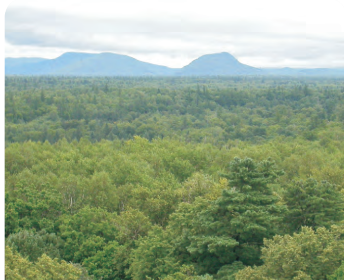
长白山（第048号重点鸟区）是中国最早建立的保护区之一，保存了东北森林的面貌。

其它重要动植物简述：兽类包括东北虎、紫貂、梅花鹿、水獭、猞猁、斑羚及麝等，也是极北鲑的分布地