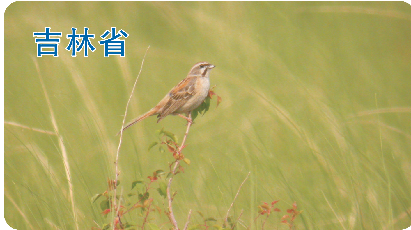
在北大岗（第038号重点鸟区）草原上的栗斑腹鹀，近年来可能因为生境变化，令这种国际性易危的鸟类数量大减。