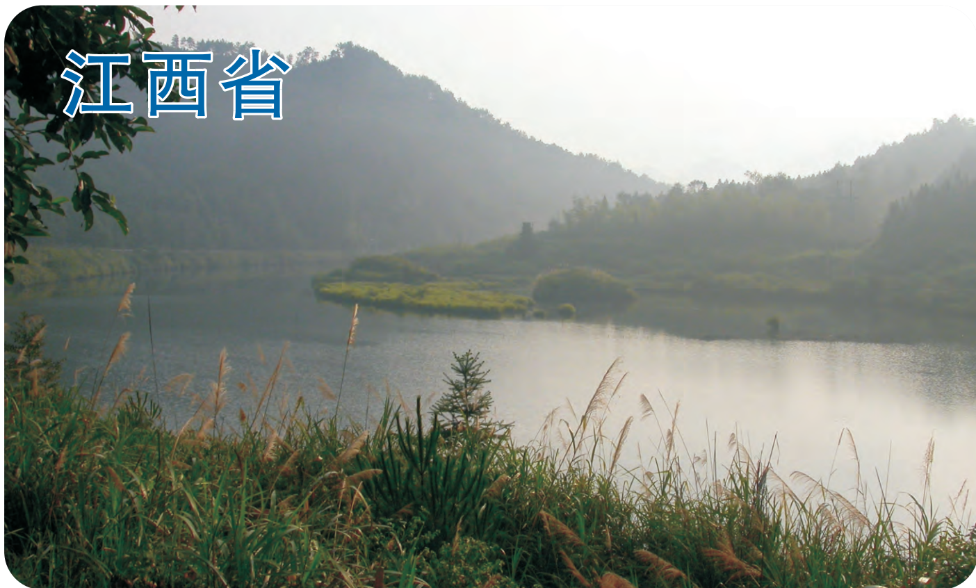
婺源（第452号重点鸟区）保存得较好的低海拔林区，在别处还没纪录的黄喉噪鹛在此地颇为常见。