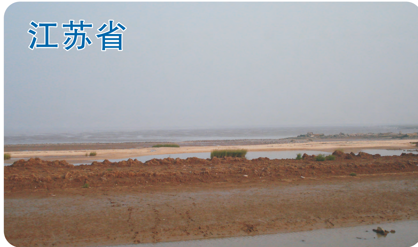
连云港（第365号重点鸟区）江苏北部沿海的滩涂地带，近年发现有大量鸬鹚类迁徙过境。