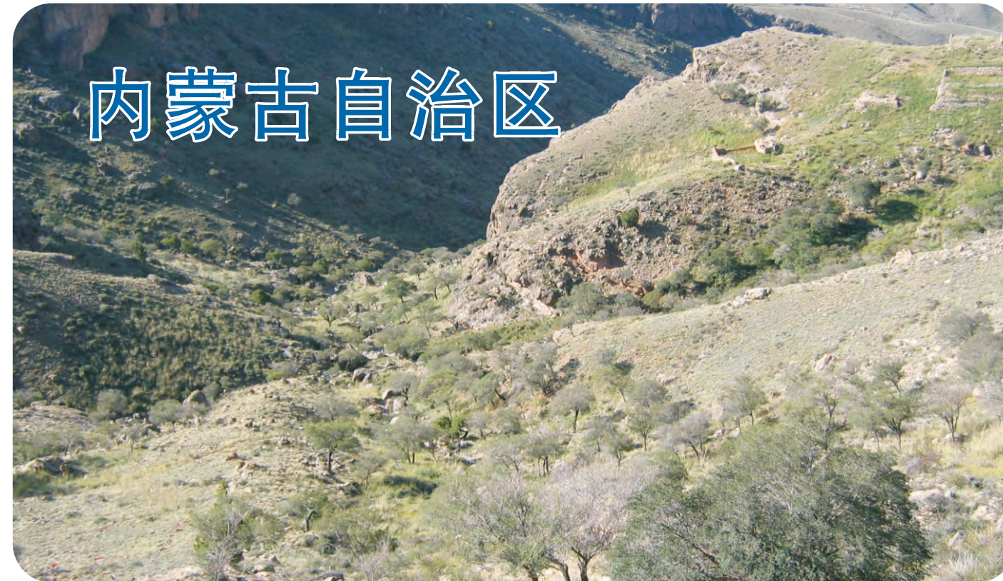
内蒙古贺兰山国家级自然保护区（第089号重点鸟区），是内蒙古最高的山脉。贺兰山横跨内蒙古、宁夏两个自治区，在两个自治区都设立了自然保护区。