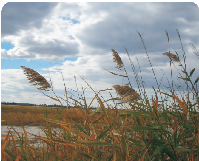
图敦吉（第073号重点鸟区），是中国的大鸨繁殖地之一，90年代后期东北林业大学、亚洲鸟盟等曾在此进行大鸨的调查与保护工作。