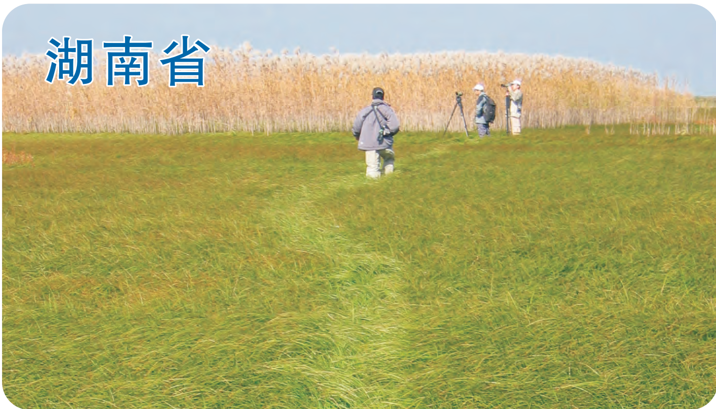
洞庭湖湖区湿地（第438号重点鸟区）洞庭湖是重要的水鸟越冬地，有世界上最大群的小白额雁越冬。