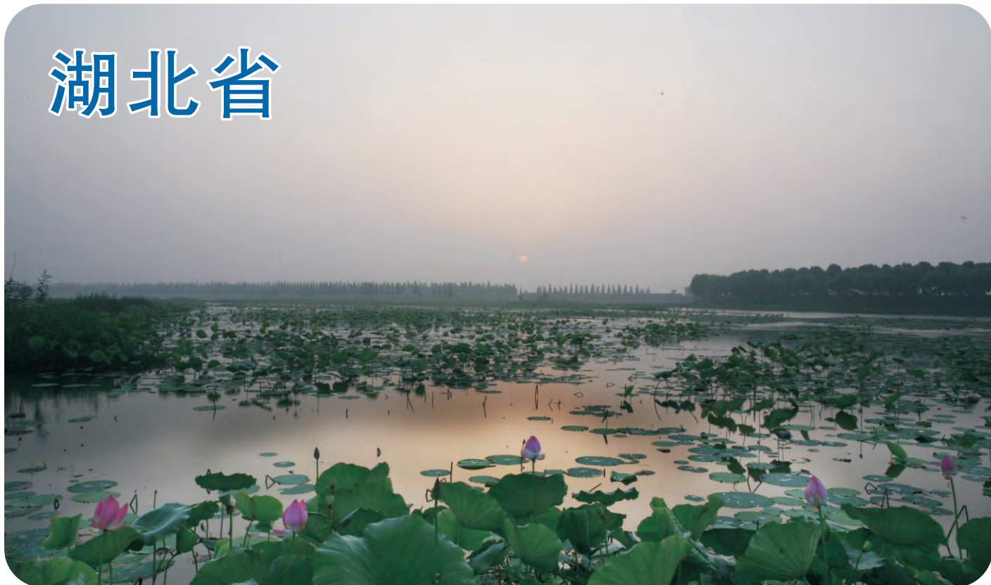
洪湖（第351号重点鸟区），湖北的江汉平原以前大小湖泊星罗棋布，但因为围湖造田，湖泊面积也大不如前。洪湖的面积也在五十年间差不多缩减了一半。