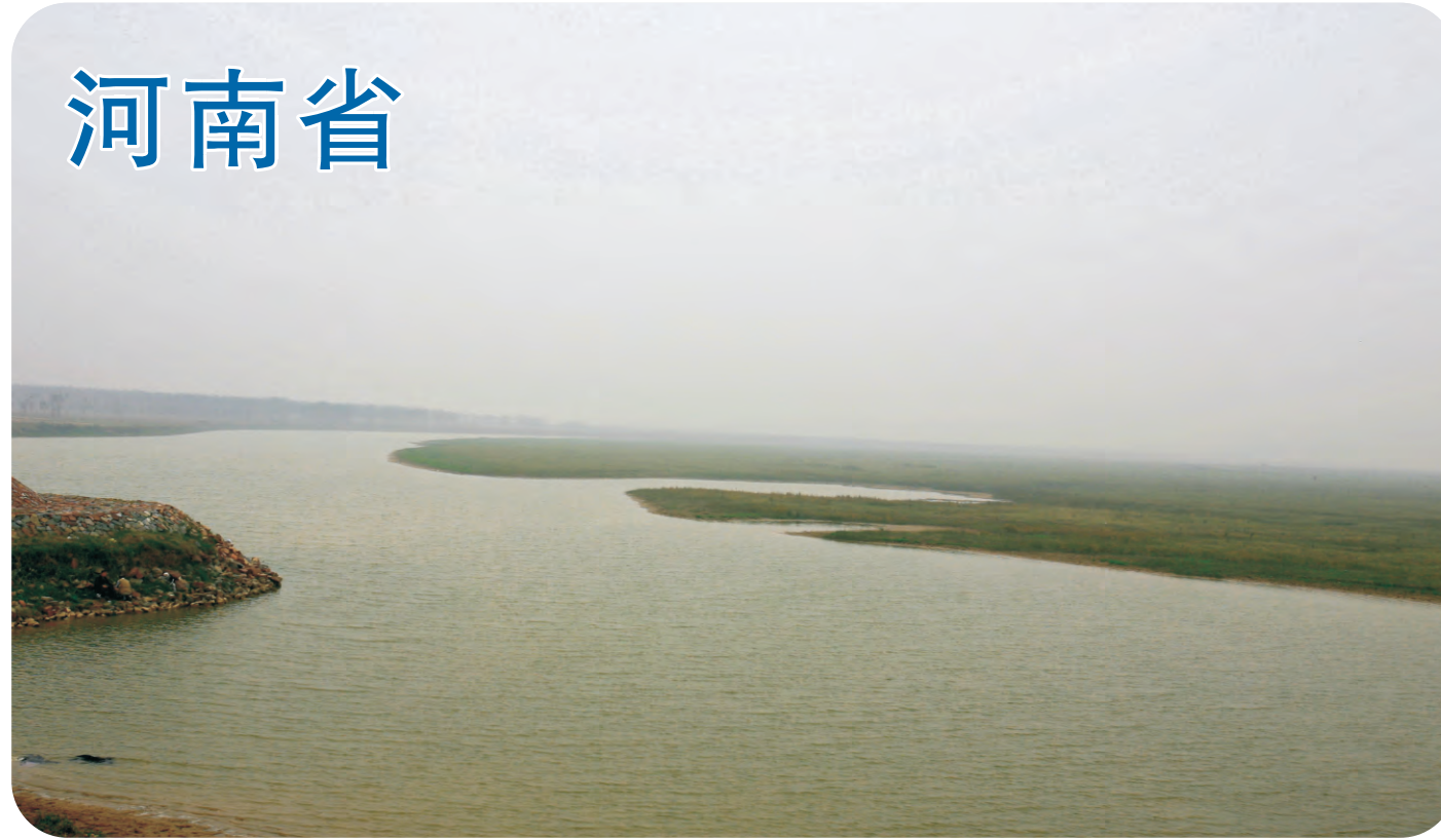
郑州黄河湿地（第338号重点鸟区）黄河中下游的湿地，是众多水鸟和大鸭的越冬地。