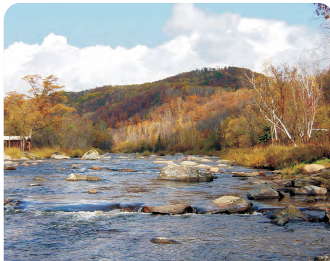
凉水自然保护区（第020号重点鸟区）所在的带岭，是中华秋沙鸭的繁殖地