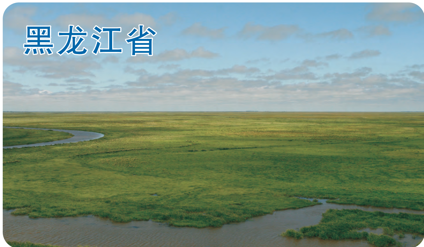
三江平原上饶力河自然保护区（第032号重点鸟区）内的雁窝岛。显示大规模开发以前“北大荒”三江平原沼泽的风貌