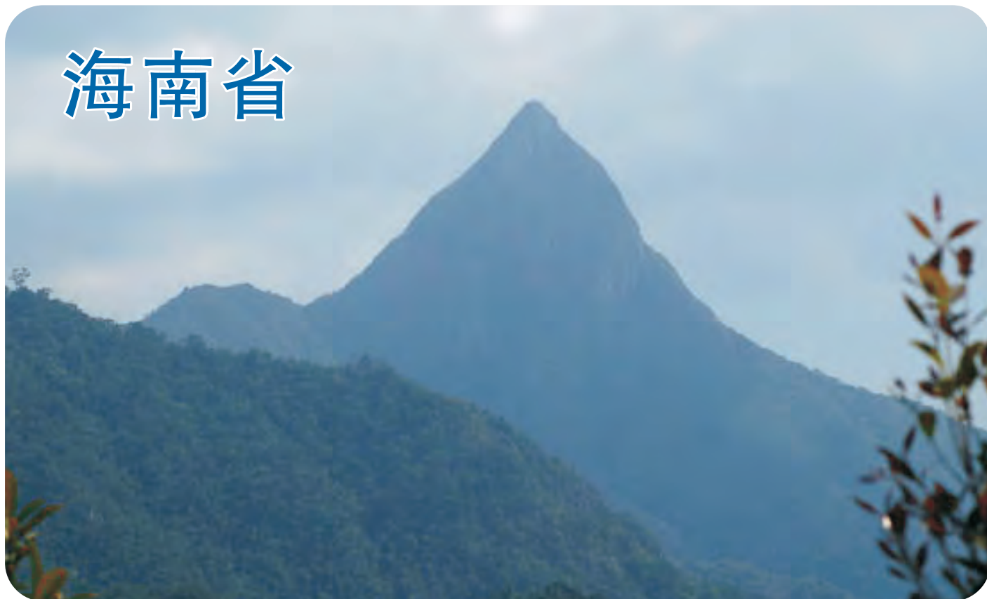
尖峰岭自然保护区（第510号重点鸟区）热带森林系统，有海南山鹧鸪等特有鸟类。