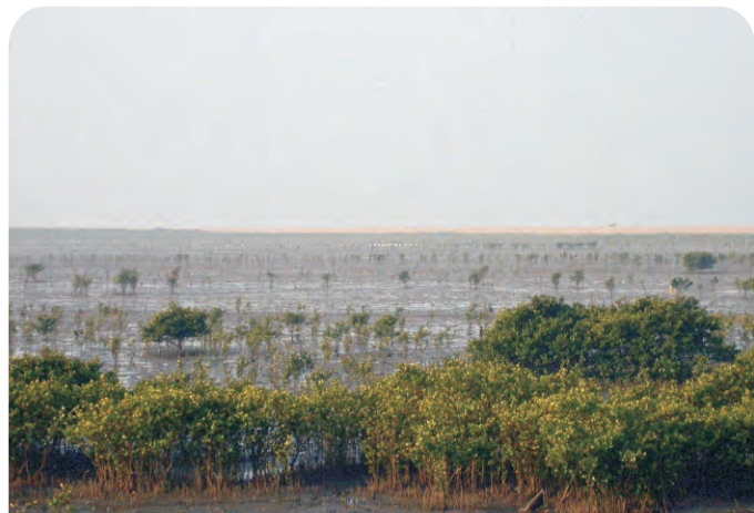
四更（第507号重点鸟区）是近年新发现的黑脸琵鹭越冬地。