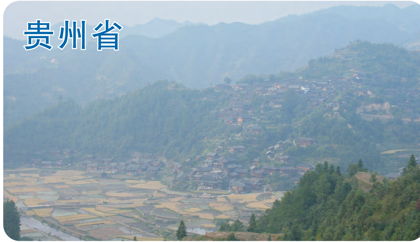
雷公山（第288号重点鸟区），地无三里平的贵州，很多山林地带都是西南特有鸟类的栖身之所。