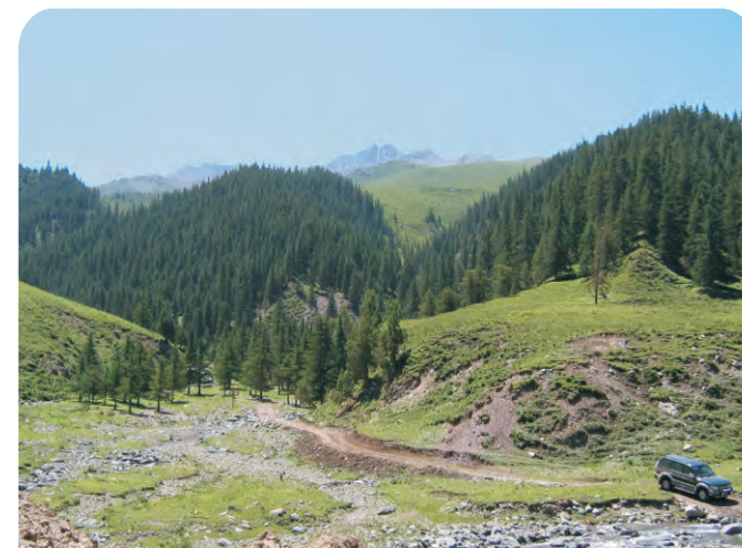
西祁连山（第159号重点鸟区），除了对鸟类重要，还是很多大型兽类的栖息地。

其它重要动植物简述：国家保护动物包括雪豹、猞猁、兔狲、藏野驴、蒙古野驴、野骆驼、马麝、白唇鹿、野牦牛、藏原羚、盘羊、岩羊等