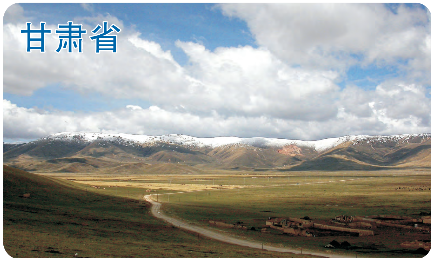
黄河首曲（第166号重点鸟区），位于甘南藏区，与四川的若尔盖相连。