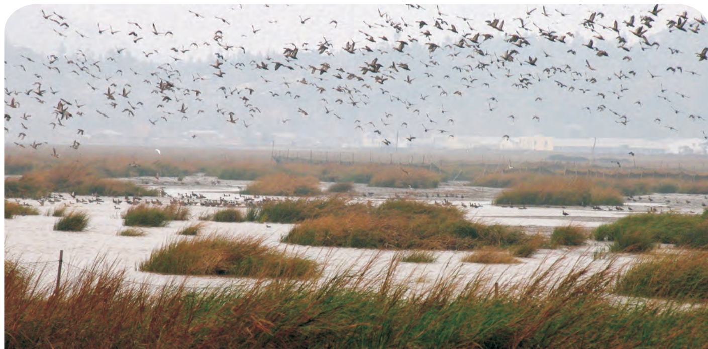
闽江河口（第411号重点鸟区）在福州市外围，也是多种世界受胁鸟类的越冬地及迁徙停留驿站。