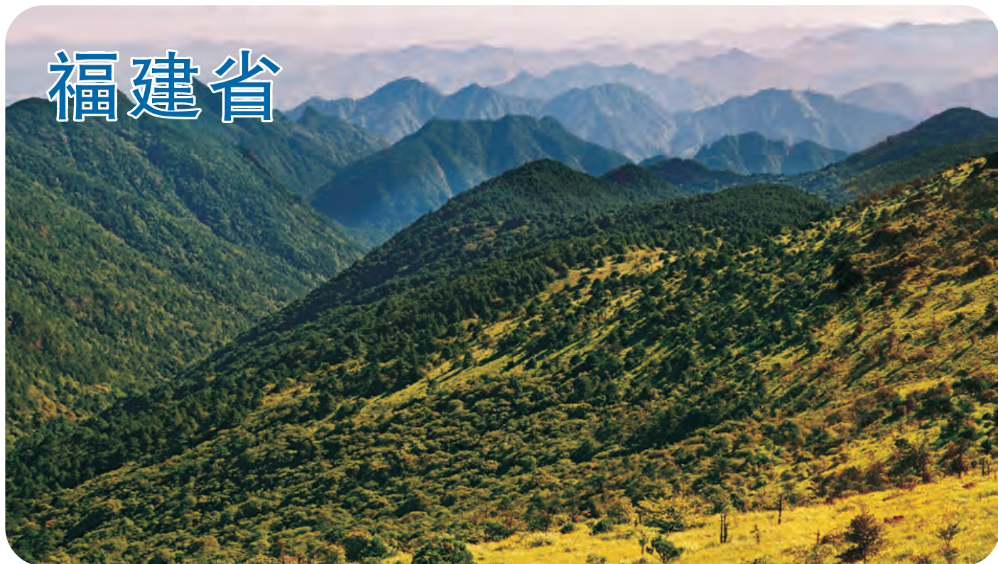
武夷山（第408号重点鸟区）位于福建与江西边境，武夷山是国内早期开展鸟类学研究的地点之一。