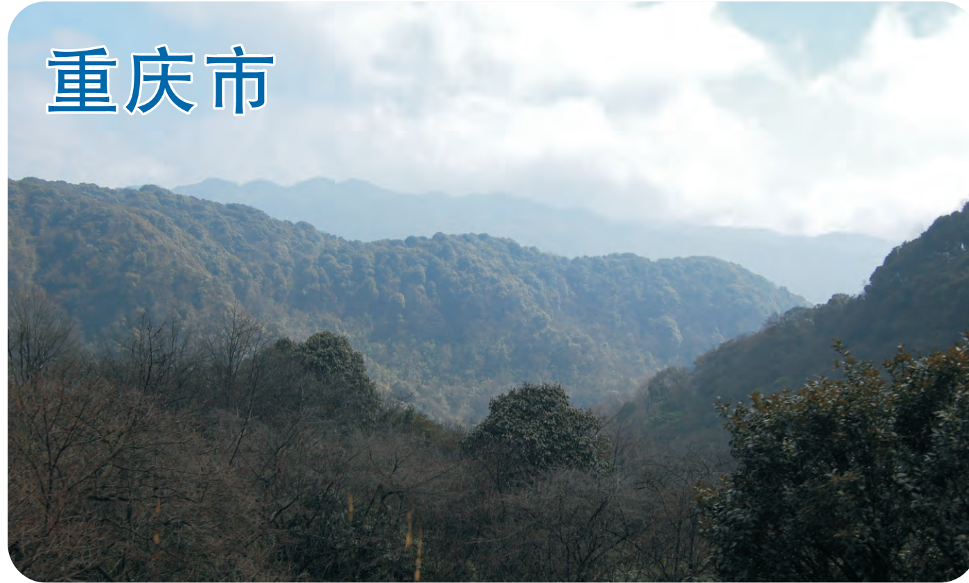
金佛山自然保护区（第229号重点鸟区），是位于四川盆地东部的亚热带森林，有银杉、珙桐等珍稀孑遗植物。