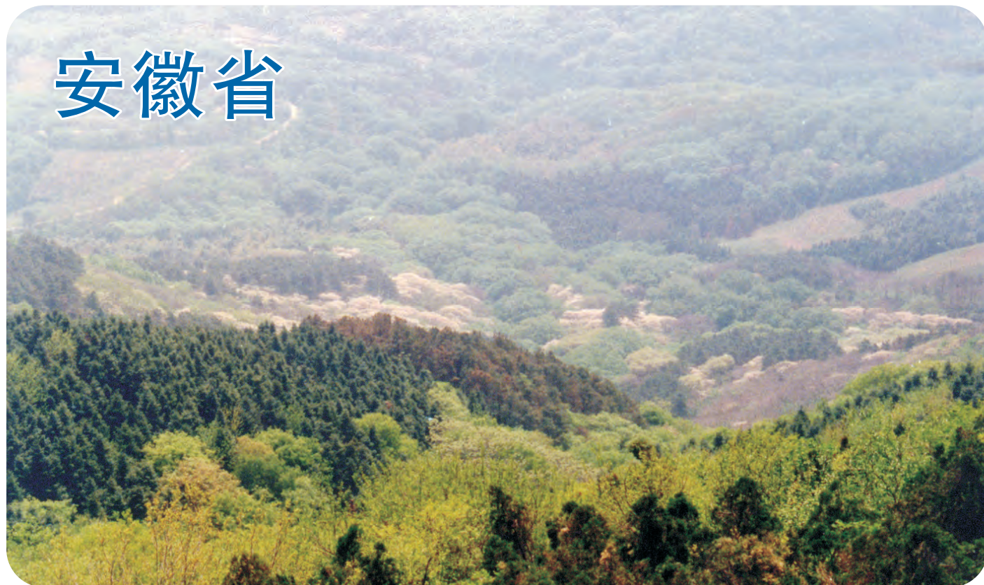
皇甫山自然保护区（第355号重点鸟区）是安徽森林环境保存的最好的山地林区，鸟类种类也朝亚热带过渡，有仙八色鸫繁殖。