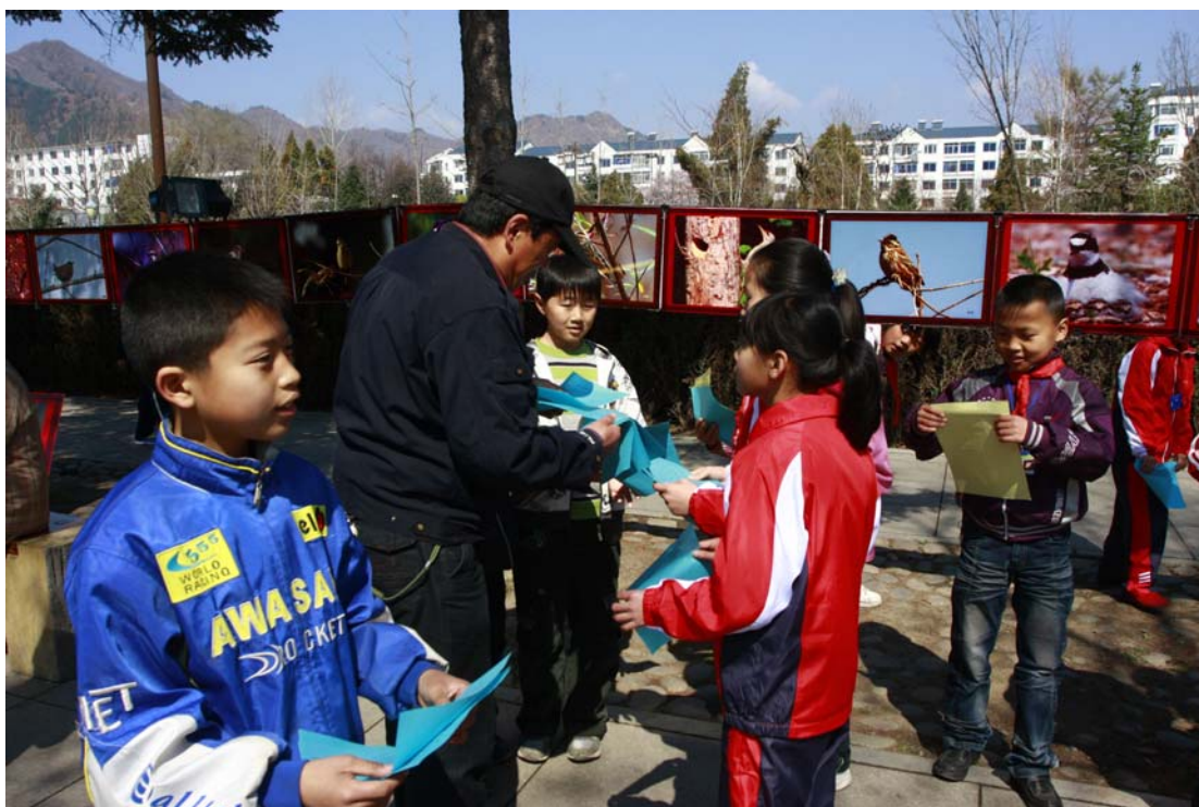
地点：集安市黄柏乡