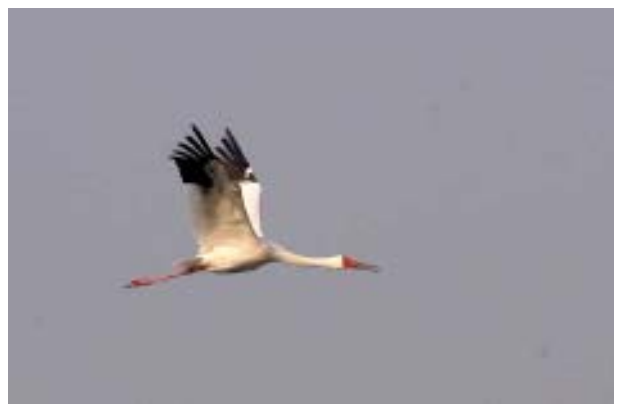
白鹤 上海

2006年12月31日-2007年1月4日,浙江临安青山湖,卷羽鹈鹕1只,当年幼鸟,后因肺部感染死亡[朱英];