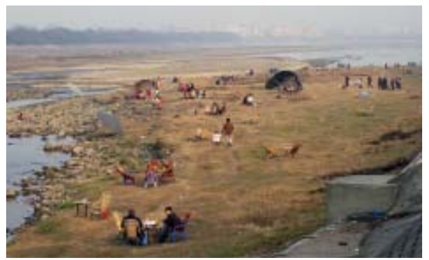
特别是在冬天成都平原难得的晴天时,茶 馆甚至搬到了河岸草坪上。

遥想五千年前,当鸭子河畔那些创造了灿烂三星堆 古文明的古蜀国先民们把"鱼凫"的形象(从出土实 物看,当为现在之秋沙鸭或鸬鹚一类)铸刻在他们的 神器——青铜神树上时,心中一定是充满了敬畏、感