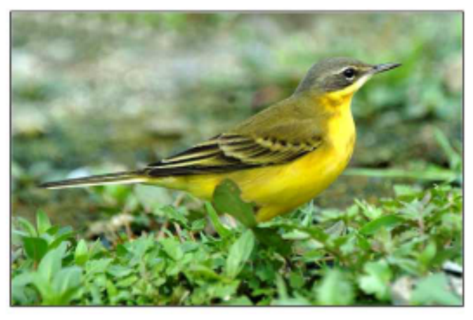
● 亚种 thunbergi, 灰头, 细白眉。亚成鸟眉型 近于成鸟。