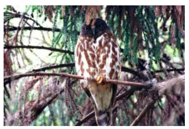
鹰鸮 摄影: 扎西学 四川成都

Jiangxi on 10<sup>th</sup> January 2007 [Hu Binhua];