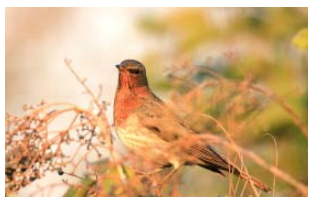
片颈鸫 上海