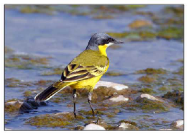
● 亚种macronyx, 云南常见,主要在中国东北繁殖。 最大的特点就是没有浅色的眉纹,有深色的眼罩。