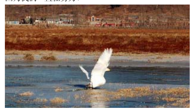
不断挣扎的天鹅

社会文明确实在进步中,但它离我们善待动物的 理想还相去甚远,每一个人都有责任尽我们所能,做好 该做的和能做的事情,希望观鸟人的理想国早日到来, 因为我们一直在努力!