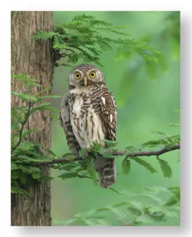
斑头鸺鹠 (杭州)